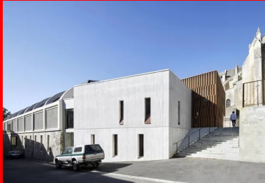
Depuis la rue basse, le nouveau volume en béton blanc brut qui abrite les bureaux de la médiathèque.