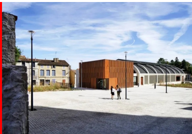
Le parvis de la médiathèque. Le cube du volume d'accueil en extension du bâtiment d'origine.