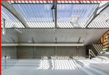
La salle de lecture principale sous la verrière rythmée par les arcs de la voûte en béton.