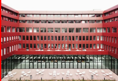
Le patio intérieur, point névralgique, à la fois poumon et cœur du campus, habillé de panneaux de façade en béton coloré d'un rouge intense.