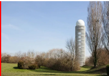
une façade au dessin hyper graphique guidé par la fonctionnalité et une trame rigoureuse.