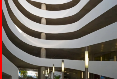
La rampe en double hélice se développe dans le vide central. Le mouvement cinétique de ses lignes et de ses courbes en béton met en scène le déplacement des véhicules entre les niveaux de stationnement.