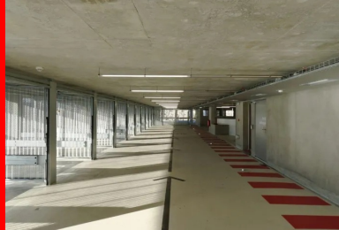
Les plateaux de stationnement sont lumineux et ventilés naturellement.