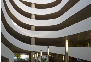
La rampe en double hélice se développe dans le vide central. Le mouvement cinétique de ses lignes et de ses courbes en béton met en scène le déplacement des véhicules entre les niveaux de stationnement.