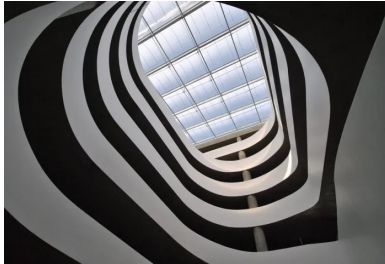
La rampe en double hélice se développe dans le vide central. Le mouvement cinétique de ses lignes et de ses courbes en béton met en scène le déplacement des véhicules entre les niveaux de stationnement.