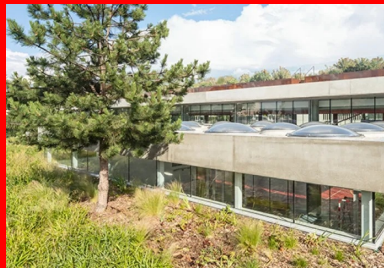
Sur la rue de Bellevue, le gymnase participe pleinement à l'aménagement paysager et semble posé sur un tapis végétal offert à la vue des riverains et des passants.

L'idée du projet est née lors de la première visite sur le site. Les vestiges du bâtiment incendié avaient été déblayés et le terrain entièrement nettoyé. Ainsi, depuis la cour du collège et le plateau sportif, s'offrait alors une large vue dégagée vers les lointains et sur le tissu pavillonnaire du bas de la ville de Colombes. En revanche, les fondations de l'ancien gymnase n'avaient pas été démolies du fait de l'existence d'une procédure contentieuse en cours à l'époque. Le cahier des charges du concours précisait, que ces fondations seraient à démolir lors du chantier de la nouvelle opération, ce qui nécessitait d'excaver le terrain d'emprise. Les concepteurs ont utilisé cette contrainte pour définir un projet présentant une architecture partiellement enterrée. Ils ont proposé de creuser plus profondément, afin de réaliser un bâtiment enfoui aux 2/3 permettant ainsi de conserver depuis le collège et les cours des vues dégagées sur les horizons lointains. Le projet s'inscrit dans la logique d'étagement déjà en œuvre dans les espaces récréatifs du collège Marguerite Duras et permet une transition douce entre l'équipement scolaire et le quartier.