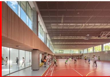
Une douce lumière naturelle pénètre généreusement et de façon homogène à l'intérieur de la salle.