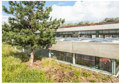
Sur la rue de Bellevue, le gymnase participe pleinement à l'aménagement paysager et semble posé sur un tapis végétal offert à la vue des riverains et des passants.

L'idée du projet est née lors de la première visite sur le site. Les vestiges du bâtiment incendié avaient été déblayés et le terrain entièrement nettoyé. Ainsi, depuis la cour du collège et le plateau sportif, s'offrait alors au regard une large vue dégagée vers les lointains et sur le tissu pavillonnaire du bas de la ville de Colombes. En revanche, les fondations de l'ancien gymnase n'avaient pas été démolies du fait de l'existence d'une procédure contentieuse en cours à l'époque. Le cahier des charges du concours précisait, que ces fondations seraient à démolir lors du chantier de la nouvelle opération, ce qui nécessitait d'excaver le terrain d'emprise. Les concepteurs ont utilisé cette contrainte pour définir un projet présentant une architecture partiellement enterrée. Ils ont proposé de creuser plus profondément, afin de réaliser un bâtiment enfoui aux 2/3 permettant ainsi de conserver depuis le collège et les cours des vues dégagées sur les horizons lointains. Le projet s'inscrit dans la logique d'étagement déjà en œuvre dans les espaces récréatifs du collège Marguerite Duras et permet une transition douce entre l'équipement scolaire et le quartier.