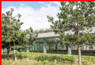
Sur la rue de Bellevue, le gymnase participe pleinement à l'aménagement paysager et semble posé sur un tapis végétal offert à la vue des riverains et des passants.