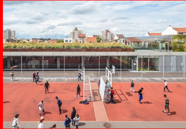
La dalle de toiture en béton du gymnase, soulevée au-dessus du sol, accueille un jardin.

La dalle de toiture de ce gymnase partiellement enterré accueille un jardin sur la quasi-totalité de sa surface, offert à la vue des riverains et des passants.