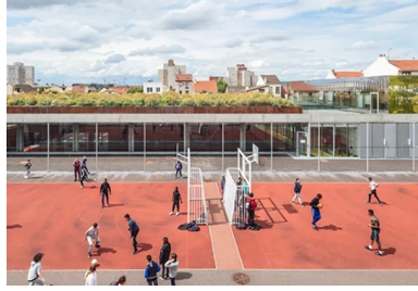
La dalle de toiture en béton du gymnase, soulevée au-dessus du sol, accueille un jardin.

La dalle de toiture de ce gymnase partiellement enterré accueille un jardin sur la quasi-totalité de sa surface, offert à la vue des riverains et des passants.