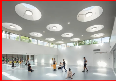
Vue sur la salle de gymnastique caractérisée par son ambiance blanche et lumineuse.

L'architecture de ce gymnase exprime la présence de l'équipement tout en s'inscrivant avec un impact minimum dans le site. « Elle porte une attention bienveillante aux habitations riveraines dont les vues et les ensoleillements sont préservés, et offre en couverture un sanctuaire de biodiversité en ville. Sur une épaisse couche de terre, euphorbes, graminées et végétations spontanées composent un paysage inattendu », précise l'architecte Djamel Kara.