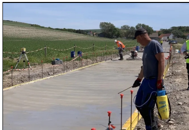
Pulvérisation d'un produit de cure à la surface du béton frais pour le protéger de la dessiccation.