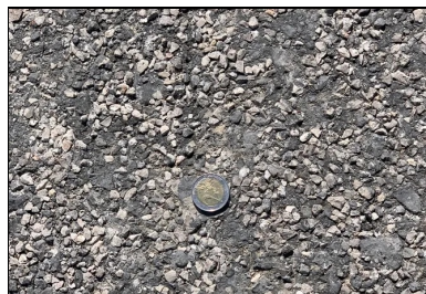
Aspect fini de la plate-forme support.