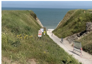
L'aménagement est destiné à permettre aux visiteurs d'accéder facilement à la plage située aux pieds des falaises.