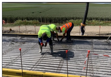
Après avoir posé les armatures longitudinales sur les distanciers, l'équipe les ligature avec un recouvrement de 64 cm.