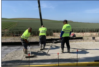
Bétonnage : alimentation du béton à la pompe, réglage au rateau, suivi du serrage du béton à l'aiguille vibrante.

Consultez le mémo technique sur le BAC en annexe.