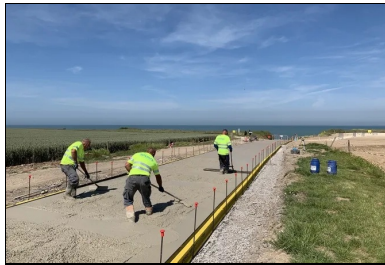
L'étalage du béton s'effectue à l'aide de différents outils : rateau, épandeur ou lissarde.