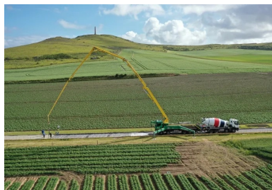
Coulage du béton sur la rue de la Mer avec vue sur le cap Blanc-Nez et l'obélisque à la mémoire de la Dover Patrol. Le débitement de la pompe limite le coulage à des sections de 60 mètres par jour (environ 270 m 3 , soit la capacité de six ou sept touppies).

Parfaitement intégrée à son environnement , esthétiquement qualitative, pratique, polyvalente et prévue pour défier le temps, la nouvelle rue de la Mer d'Escalles a été achevée pour l'ouverture de la saison estivale de 2020. Les vacanciers du Grand Site des Deux Caps sauront l'apprécier. Vu cette première, nul doute que ce chantier en préfigure d'autres dans le département du Pas-de-Calais !