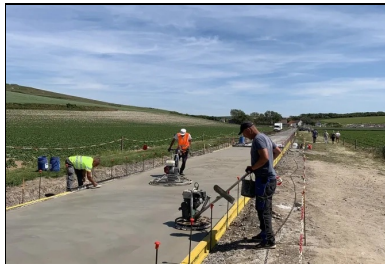
Deux lisseuses mécanisées (hélicoptères) achèvent le lissage fin.