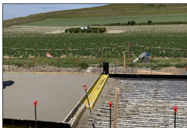
Pose d'un joint d'arrêt de bétonnage provisoire en fin de journée.