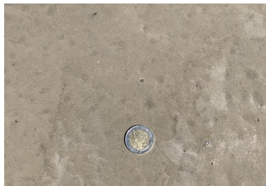
Aspect du BAC après pulvérisation du produit de cure.

Pour finir, un produit de cure est pulvérisé à la surface du béton frais pour le protéger de la dessiccation.