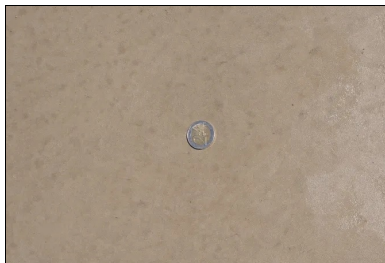
Aspect du BAC après lissage à l'hélicoptère.