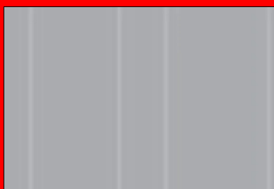
Schéma illustrant le comportement d'un revêtement en béton, exécuté sans joints mais doté d'une nappe d'armatures longitudinales continues. Conséquences : fissuration fine et contrôlée.