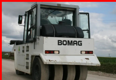
Compacteur à pneus en action.