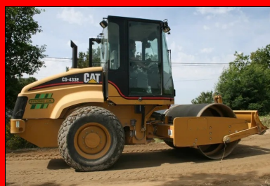
Compactage au rouleau vibrant.