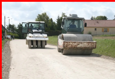
Atelier de compactage.

Le compactage est une opération qui consiste à réduire les vides contenus dans un matériau foisonné afin d'augmenter sa cohésion et par conséquent d'assurer la stabilité de l'ouvrage dans le temps. Il est réalisé soit au moyen de compacteurs statiques (à pneus ou à pieds dameurs) qui agissent uniquement par leur poids, soit à l'aide de compacteurs vibrants (à bille lisse ou à pieds dameurs) qui agissent par leur poids et par la vibration (amplitude et fréquence) qu'ils génèrent, soit au moyen des deux types de compacteurs. En fonction de la nature des matériaux et de l'objectif de compacité recherché, on détermine le type de compacteur (avec sa vitesse et le nombre de passes) et l'épaisseur maximale de la couche à compacter.