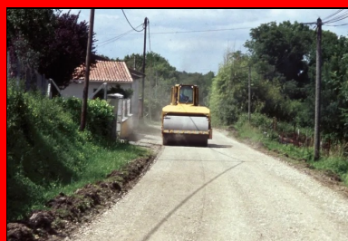
Compactage au rouleau vibrant.