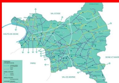
La carte des pistes cyclables existantes et en cours de réalisation en Seine-Saint-Denis.

En 2019, dans le cadre du Plan Mobilité durable du département, 21 km de pistes cyclables avaient déjà vu le jour dans le 93. Début 2020, un autre projet a été réalisé à Aulnay-sous-Bois, le long de l'avenue Suzanne-Lenglen. Un choix logique pour une ville qui a manifesté très tôt son intérêt pour ce mode de locomotion, puisqu'elle s'est dotée d'un schéma directeur des itinéraires cyclables dès 2012.