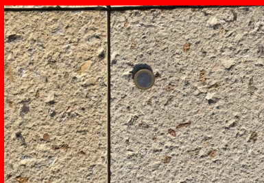
Les joints de retrait-flexion ont été réalisés le lendemain du coulage par sciage sur un tiers de l'épaisseur du béton, tous les 3 ml (piste cyclable) et tous les 1,5 ml (voie piétonne).

Des joints de retrait-flexion ont été réalisés le lendemain du coulage par sciage sur un tiers de l'épaisseur du béton, tous les 3 ml (piste cyclable) et 1,5 ml (voie piétonne). Pour ne pas épauffer les bords, ils ont été remplis avec un coulis à prise accélérée avant la réalisation de la finition piquée. Ils ont été ensuite rouverts par sciage.