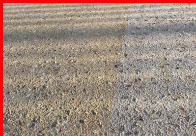
Les deux finitions de béton : ocre clair à gauche et gris clair à droite.

Pour le traitement de surface, le conseil départemental innove par rapport à l'ouvrage existant en retenant une finition piquée, proche du bouchardage, mais permettant d'obtenir une surface plus régulière, tout en offrant une bonne adhérence. Esthétiquement, le changement est peu notable.