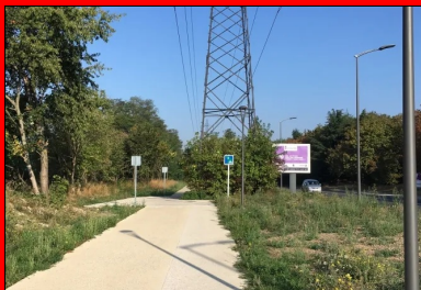
La ligne à haute tension surplombant la piste cyclable et la bande piétonne.