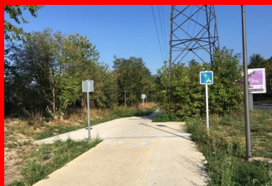
La piste cyclable réalisée début 2020 par Eurotech Floor à Aulnay-sous-Bois.

Soucieux de développer les « mobilités douces », le département de la Seine-Saint-Denis souhaite devenir « 100 % cyclable d'ici à 2024 », année des Jeux olympiques de Paris. Il a lancé un ambitieux programme de construction, marché sur lequel les entreprises du béton décoratif sont bien placées. Exemple avec Eurotech Floor et son concept de béton « biomécanique ».