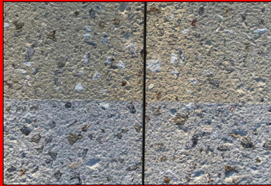
La voie piétonne (de couleur grise) et la piste cycliste (de couleur jaune).