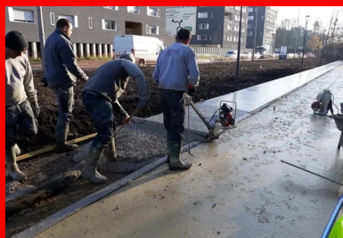
Le tirage du béton au rouleau Striker. Il n'a pas été vibré pour ne pas faire descendre le granulat, qui doit rester en surface pour le bon aspect visuel de la finition piquée.

Note de calcul des joints de dilatation Lire la suite