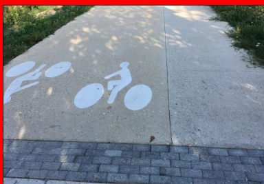
La piste cyclable et la bande piétonne ont été rapidement ouvertes à la circulation.