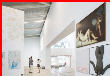
Le plateau d'exposition du Frac dont les espaces sont différenciés par les cimaises et l'abaissement progressif du plafond.

Bien que dédié à des univers culturels distincts, depuis l'extérieur, rien ne laisse deviner la répartition des locaux entre l'Alca, l'Oara et le Frac. De fait, les ouvertures ne donnent presque aucun indice et le bâtiment semble assez hermétique avec ses grandes surfaces pleines qui abritent les réserves du Frac et les salles nécessairement aveugles. Depuis l'intérieur, la perception est autre. Les bureaux installés dans les deux piles profitent des fenêtres posées au nu extérieur qui donnent à voir l'épaisseur de l'enveloppe du bâtiment – du voile au parement en béton – et qui, par leur disposition serrée, se révèlent très favorables à la pénétration de la lumière. Leur aménagement joue des matériaux sans apprêt – voile béton laissé brut et sol en béton ciré, équipement électrique de type industriel... Les foyers s'ouvrent généreusement sur l'extérieur et la petite salle de répétition de l'Oara, située au 2e étage, vitrée sur toute sa longueur, donne sur la chambre urbaine : cet espace extérieur haut, cœur évidé de l'édifice, que des skaters, des danseurs, des musiciens ou de simples badauds investissent. Leurs mouvements sont perceptibles depuis le hall grâce aux grandes « fenêtres papillons » amplifiées d'un côté par un miroir, placées à l'articulation des rampes et de la chambre urbaine afin d'apporter de la lumière. La « perméabilité » recherchée entre l'intérieur et l'extérieur contribue à la vie de l'équipement.