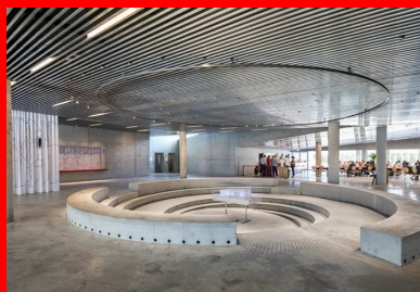
L'espace central du hall commun conçu en agora s'inscrit dans le sol avec ses gradins circulaires de béton brut.

projection. Les trois derniers étages sont occupés par le Fonds régional d'art contemporain (Frac) de la région Nouvelle-Aquitaine qui s'étend dans la partie en pont où s'organisent les réserves et, au-dessus, la grande salle d'exposition de 1 200 m 2 . Scindée en diagonale par une immense cimaise fixe qui suit la poutre faîtière, complétée par des cimaises secondaires, cette salle offre une diversité de volumes d'autant plus grande qu'à ce 5e étage, la hauteur utile varie de 6 à 3 m, suivant la pente descendante de la toiture vers le nord. Il en résulte la compression progressive de l'espace jusqu'au grand salon adjacent de la Méca entièrement vitré sur la terrasse de 850 m 2 d'où l'on peut jouir d'une vue panoramique sur le centre-ville et le fleuve. Les pompes à chaleur et les équipements techniques sont occultés dans les rambardes de cette terrasse. À l'étage supérieur, 6e et dernier, le foyer de l'auditorium de 90 places s'ouvre sur toute sa longueur côté Garonne par une fenêtre panoramique vertigineuse qui nous plonge dans le paysage.