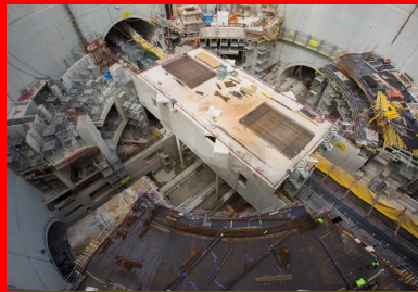
Dans un espace de travail particulièrement exigü, tous les travaux de Génie Civil se déroulaient en coactivité.

Jusqu' alors, les travaux de la gare suivaient les étapes de construction « classiques » d'un ouvrage de Génie Civil de grande profondeur. Mais le puits possède une particularité forte : il doit accueillir dans son volume les deux quais de près de 120 m de long des stations superposées des lignes 14 (axe nord-sud) et 15 (axe est-ouest) du métro.