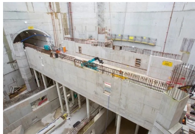
Le pont provisoire situé dans l'axe de la ligne 14 a permis de couler le hourdis inférieur du pont-cadre définitif.