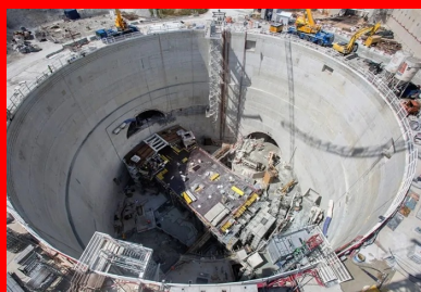
Les quais de la ligne 14 et 15, situés respectivement à 37 m et 49 m de profondeur, se superposeront.

Les travaux de construction de la gare, incluse avec quatre autres stations et une section de 8 km de tunnel à forer dans le lot « T3C » du GPE, ont été attribués en février 2017 au groupement d'entreprises piloté par Vinci Construction Grands Projets.