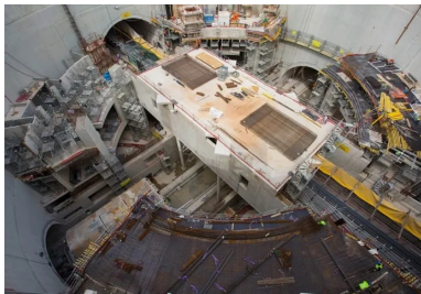
Dans un espace de travail particulièrement exige, tous les travaux de Génie Civil se déroulaient en coactivité.