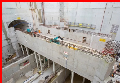
Le pont provisoire situé dans l'axe de la ligne 14 a permis de couler le hourdis inférieur du pont-cadre définitif.