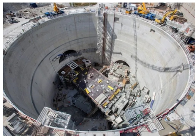
Les quais de la ligne 14 et 15, situés respectivement à 37 m et 49 m de profondeur, se superposeront.

Les travaux de construction de la gare, incluse avec quatre autres stations et une section de 8 km de tunnel à forer dans le lot « T3C » du GPE, ont été attribués en février 2017 au groupement d'entreprises piloté par Vinci Construction Grands Projets.