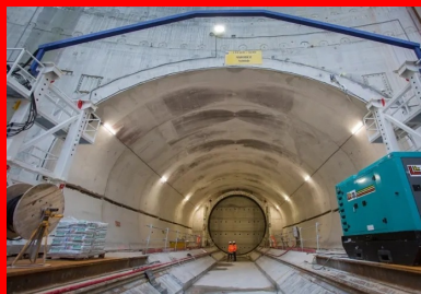
Amorces d'un tunnel réalisées depuis le puits.

La gestion de cette phase complexe s'est notamment traduite par la mise en place d'un pont provisoire en charpente métallique situé dans l'axe de la ligne 14 à 12 m au-dessus du fond du puits. Cet ouvrage provisoire avait deux fonctions : « Il a été utilisé dans un premier temps comme plateforme logistique et de travail pour terrasser les deux amorces du tunnel de la ligne 14. Une fois cette phase terminée, il a permis de couler le hourdis inférieur du pont-cadre définitif sur lequel circuleront les métros de la ligne 14. »