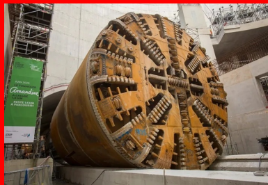
Le passage d'Amandine, tunnelier de la ligne 15, a permis de libérer le volume nécessaire à l'achèvement des neuf niveaux de planchers.

Ce chantier de Génie Civil titanesque, qui aura compté jusqu'à 200 personnes au pic d'activité, ouvrant 7 j/7 et 24 h/24, devrait s'achever mi-2022. Les mises en service du prolongement sud de la ligne 14 et de la ligne 15 sud sont quant à elles respectivement prévues pour mi-2024 et début 2025.