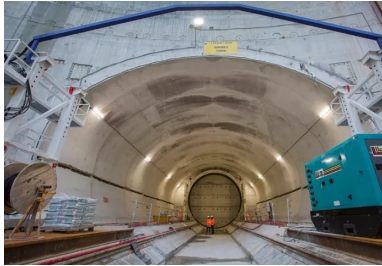
Amorces d'un tunnel réalisées depuis le puits.

La gestion de cette phase complexe s'est notamment traduite par la mise en place d'un pont provisoire en charpente métallique situé dans l'axe de la ligne 14 à 12 m au-dessus du fond du puits. Cet ouvrage provisoire avait deux fonctions : « Il a été utilisé dans un premier temps comme plateforme logistique et de travail pour terrasser les deux amorces du tunnel de la ligne 14. Une fois cette phase terminée, il a permis de couler le hourdis inférieur du pont-cadre définitif sur lequel circuleront les métros de la ligne 14. »