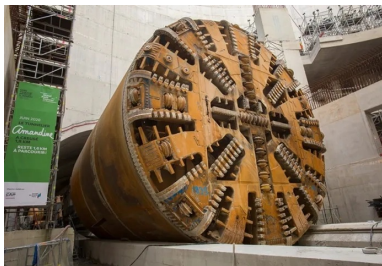
Le passage d'Amandine, tunnelier de la ligne 15, a permis de libérer le volume nécessaire à l'achèvement des neuf niveaux de planchers.

Ce chantier de Génie Civil titanesque, qui aura compté jusqu'à 200 personnes au pic d'activité, œuvrant 7 j/7 et 24 h/24, devrait s'achever mi-2022. Les mises en service du prolongement sud de la ligne 14 et de la ligne 15 sud sont quant à elles respectivement prévues pour mi-2024 et début 2025.