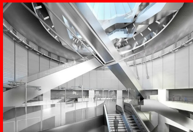
Le vide central de la gare, permettant d'accéder aux quais situés à grande profondeur, sera baigné de lumière naturelle zénithale.

Le chantier de la gare « Villejuif Institut Gustave Roussy », du GPE, a été le théâtre d'un événement inédit : le croisement, 15 m l'un au-dessus de l'autre, des deux tunneliers.