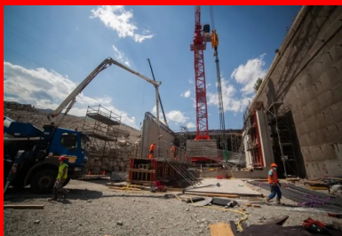
Le chantier de construction de la tranchée couverte (au centre) est réalisé à l'abri d'une paroi berlinoise (à droite).

Non loin de la frontière italienne, au cœur de la vallée de la Maurienne en Savoie, la tranchée couverte de Saint-Julien-Montdenis est la porte d'entrée du futur tunnel ferroviaire de 57,5 km qui traversera les Alpes pour relier Lyon à Turin à grande vitesse. La réalisation de cet ouvrage cadre en béton armé nécessite le déplacement puis le rétablissement de la route départementale et de l'autoroute qu'il doit soutenir. La présence proche d'habitations a quant à elle entraîné la construction d'un soutènement vertical temporaire très technique. Le tout, en pleine crise sanitaire liée à la Covid-19. Reportage.