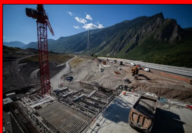
Pour pouvoir respecter le phasage de déplacement des chaussées, la tranchée couverte est construite en 4 phases.