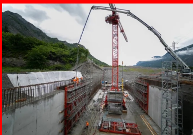
Coulage en cours de l'un des voiles latéraux de la tranchée couverte, dont l'épaisseur atteint 1 m.

Autre contrainte pour les entreprises : quasiment toutes les phases de construction se situaient sur le chemin critique du chantier, le planning étant contraint par la nécessité de déplacer puis de rétablir l'autoroute avant la période de viabilité hivernale. « Ce compte à rebours déjà millimétré a été singulièrement resserré par les conséquences de la crise sanitaire liée à l'épidémie de Covid-19 », ajoute Olivier Viret. Le confinement de mars 2020 a ainsi entraîné l'arrêt du chantier pendant deux mois. « Ce retard était critique pour le chantier car nous devions impérativement rétablir l'A43 dans son tracé d'origine et la remettre au concessionnaire, la SFTRF (Société française du tunnel routier de Fréjus), avant la période de viabilité hivernale », se rappelle Frédéric Fabre.