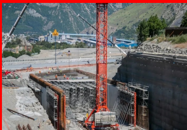
Les traverses supérieures de la tranchée couverte sont coulées en place à partir de tours d'étalement.