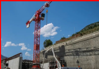
Pour contourner les difficultés d'accès, le béton est coulé par l'intermédiaire d'un camion-toupie équipé d'une pompe.