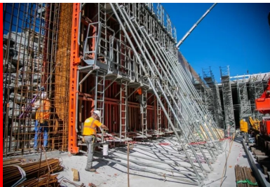
Préparation des banquettes métalliques nécessaires au coulage d'un voile latéral.