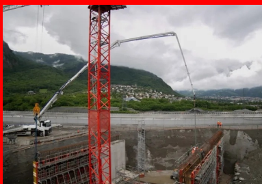
Le déploiement du bras de distribution articulé de la pompe à béton permet d'atteindre tous les points de coulage du chantier, même les plus difficilement accessibles, comme ici lors de la construction d'un voile latéral de l'ouvrage cadre.

Pour arriver à rétablir l'autoroute à temps, le groupement d'entreprises a mis les bouchées doubles, en augmentant le nombre de jeux de banches, en renforçant les équipes de chantier et en modifiant les méthodes de chantier. « Initialement, nous avions prévu d'utiliser un outil coffrant pour couler l'ouvrage demi-plot par demi-plot, illustre Olivier Viret. Pour combler le retard, nous avons étayé et coulé les plots 2 et 3 en une seule étape. » Finalement, le projet a pu être livré en temps et en heure, grâce au dialogue constructif et bienveillant qui s'est noué entre le groupement d'entreprises, le groupement de maîtrise d'œuvre, le maître d'ouvrage et la SFTRF – tous unis dans un même objectif face à la crise sanitaire : livrer le projet en temps voulu.