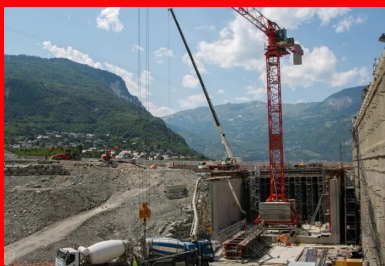
Les 9 000 m 3 des bétons de structure sont coulés en place. Le chantier dispose d'une centrale à béton principale située à Saint-Jean-de-Maurienne et d'une centrale de secours à Saint-Julien-Montdenis.

« Comme souvent lorsqu'un ouvrage est réalisé sous des infrastructures existantes, la construction de la tranchée couverte devait d'abord s'adapter à un phasage général complexe », expose Frédéric Fabre, responsable du projet pour Telt. Le trafic sur l'A43 et la RD1006 devait en effet être maintenu continuellement durant toute la durée des travaux. La première opération du chantier a donc consisté à déplacer la RD1006 et l'A43 à quelques dizaines de mètres du site du chantier, sur une plateforme temporaire le long de la rivière de l'Arc. Une fois cette lourde étape réalisée, les équipes travaux ont alors pu s'emparer du site du chantier pour réaliser la fouille à l'intérieur de laquelle serait bâtie la tranchée couverte. 250 000 m 3 de déblais ont ainsi été extraits de la butte jouxtant le village de Villard-Clément.