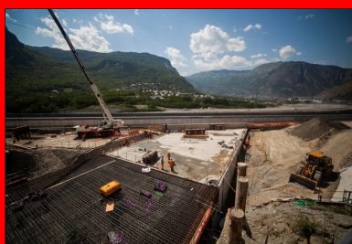
La construction de la tranchée couverte nécessite le déplacement puis le rétablissement de la RD1006 et de l'A43 (au fond).

C'est l'une des plus grandes infrastructures en cours de construction dans le monde. La future liaison ferroviaire de 270 km entre Lyon et Turin est un projet au long cours dont la section transfrontalière comprend le tunnel bitube de base du Mont-Cenis, d'une longueur record de 57,5 km (voir encadré 1). Pour anticiper le percement de cet ouvrage souterrain majeur, son maître d'ouvrage binational Telt (Tunnel Euralpin Lyon Turin) aménage actuellement les sections d'approche dans la vallée de la Maurienne. Sur le site de Saint-Jean-de-Maurienne en Savoie, plusieurs lots de travaux sont ainsi en construction : des digues en rive gauche de la rivière de l'Arc, des ouvrages de génie civil en gare de Saint-Jean-de-Maurienne et la tranchée couverte de Saint-Julien-Montdenis. Cette dernière, qui raccordera l'entrée du tunnel de base côté français, permettra le passage des voies ferrées de la future ligne sous l'autoroute A43 et la route départementale 1006.