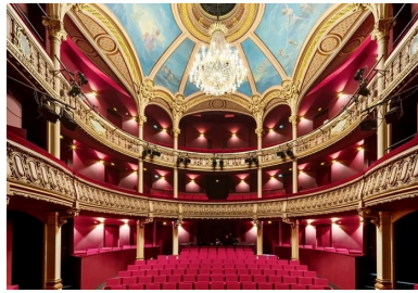
La salle historique restaurée et adaptée aux attentes techniques d'un théâtre contemporain.

scène, quitte à faire frémir les spectateurs.