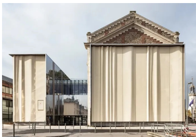
À l'opposé, le drapé de béton habille l'émergence de la cage de scène agrandie.

Au centre d'Évreux, à l'angle de l'allée des Soupirs et de la rue de Grenoble, ce petit théâtre à l'italienne de style Beaux-Arts emprunte son nom à son architecte prénommé Léon. Inauguré en 1903 et protégé au titre des monuments historiques, ce bâtiment compte parmi les plus remarquables de la ville. Léon Legendre avait orienté l'entrée, le foyer et son balcon vers l'ouest où la façade principale du théâtre, ornée des bustes de Corneille et de Boieldieu sculptés par Albert Miserey, regarde aujourd'hui le bel orme de l'actuel square Georges Brassens.