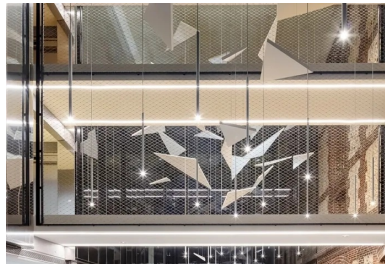
Scansion des passerelles dans le hall.

Dans la partie neuve, l'isolation extérieure du bâtiment est intégrée entre la structure en béton banché et la vêtue préfabriquée. Afin d'optimiser la pérennité du béton, les panneaux sont traités avec un hydrofuge photo-catalytique qui protège l'épiderme du béton tout en laissant respirer les supports traités.