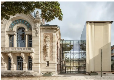
Face au square, l'articulation entre la façade historique et l'extension.

Après treize ans de fermeture, un drapé de béton blanc frappe les trois coups de la réouverture du théâtre Legendre, rénové et agrandi par les architectes de l'agence OPUS 5.