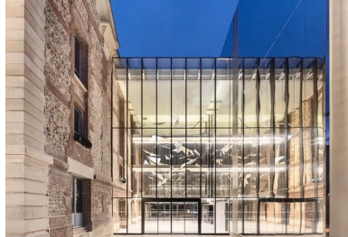
Envolée d'abat-sons dans la transparence du hall.

Pour composer cette tenture à l'épiderme lisse et velouté qui est une réelle prouesse technique, 27 panneaux toute hauteur à géométrie variable et de grand format (2,28 m de large sur 13,5 m de hauteur) ont été modélisés puis préfabriqués par l'entreprise Guillem dans son atelier du Finistère. Pour limiter l'épaisseur courante de ces panneaux à 8 cm et leur poids à 11,2 t selon les règles prescrites par le bureau de contrôle, l'entreprise a fabriqué quatre moules différents en contreplaqué enduit . Des contre-moules en polystyrène ont permis de reproduire le tracé de la forme moulée sur le coffrage et d'obtenir les 8 cm d'épaisseur.