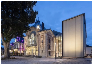
Dans l'éclairage nocturne, le dialogue entre le patrimoine et l'architecture contemporaine gagne une forme d'emphase qui théâtralise le lieu depuis l'espace public et met le spectateur en condition.