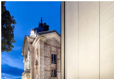
Dans l'éclairage nocturne, le dialogue entre le patrimoine et l'architecture contemporaine gagne une forme d'emphase qui théâtralise le lieu depuis l'espace public et met le spectateur en condition.

Tout en confortant le sol archéologique, Pierre Tisserand a dû résoudre des questions complexes de plan et de symétrie déportée. Débarrassée des ajouts qui l'altéraient, la façade sud a retrouvé ses proportions, ses percements et sa modénature de brique et de silex. Le vaste hall contemporain, dont la transparence crée une percée visuelle vers l'est de la ville, s'y adosse pour la relier à l'extension latérale qui accueille les loges, le foyer des artistes, les bureaux et une salle de répétition. De même longueur que la façade sud, cette extension étroite et longiligne s'harmonise avec les proportions de l'existant sans l'écraser. À l'arrière du théâtre, une autre addition augmente la profondeur de scène afin de lui donner les fonctionnalités qu'exigent les spectacles contemporains. Elle intègre la plateforme élévatrice d'acheminement des décors et gère la circulation des artistes entre cour et jardin.