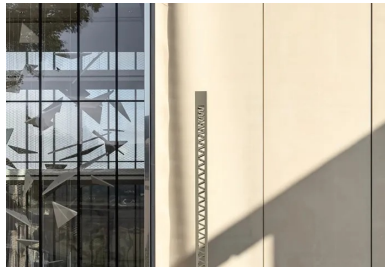
La précision des liaisons entre le béton et les éléments verriers témoigne d'une mise en œuvre et d'une qualité d'exécution particulièrement soignées.

Romain Guillem, co-gérant de cette entreprise bien connue dans le domaine de la préfabrication du béton , nous en dit plus sur les particularités de cette mise en œuvre complexe à plus d'un titre : « La complexité tient d'abord à la finesse des panneaux par rapport à leur longueur. C'est en évitant ces éléments pour limiter l'épaisseur à 8 cm que l'on a respecté leur poids limite. Rigidifiés par trois raidisseurs de 15 cm d'épaisseur sur 25 cm de large, en partie arrière, ils sont fixés par des suspentes aux voiles périphériques. Le béton fibré à ultra haute performance de 90 mégapascals utilisé est caractérisé par sa très forte résistance à la compression. Il présente en outre l'avantage de se dispenser de tout ferrailage dans les parties ondulées de faible épaisseur où les fibres font office d'armature, les ferrillages en acier étant réservés aux raidisseurs. »