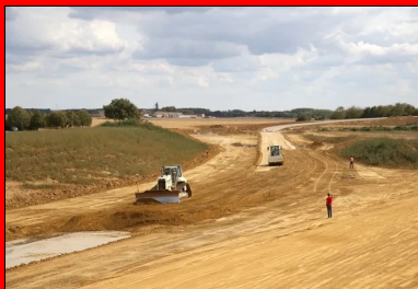
Réglage et compactage.