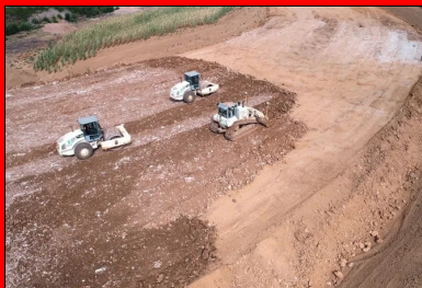
Vue d'ensemble des travaux de réalisation du remblai, par couches successives.

« 90 % du parc des machines de terrassement sont asservis GPS, 100 % des machines de réglage sont équipées en ATS (système de suivi dynamique de haute précision) », précise Roger Meschin, directeur du matériel. De son côté, Pierre Stoquet, directeur d'exploitation, ajoute : « Nos conducteurs d'engins appliquent une procédure d'entreprise pour la vérification des points de contrôle que notre géomètre-topographe enregistre à chaque début de chantier sur trois ou quatre plots disposés sur le chantier. »