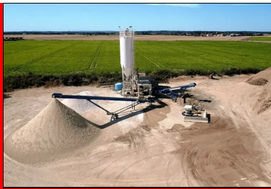
La plate-forme de revalorisation des matériaux inertes du BTP de RCM, implantée à Montereau-sur-le-Jard.