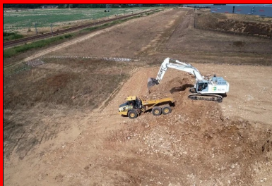
Les terrassements ont permis la réalisation d'un remblai « d'une hauteur de 7 m ».