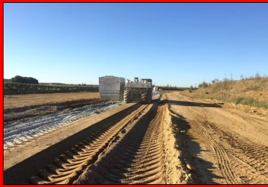
L'épandage du liant hydraulique routier ROC VDS d'EQUIOM à raison de 4,75 % (soit plus de 29 kg/m 3 ).

L'opération de traitement, proprement dite, y a succédé. Elle a été réalisée en deux phases successives : un épandage du liant hydraulique routier à raison de 4,75 % de ROC VDS (soit plus de 29 kg/m 3 ) à la surface du matériau à l'aide d'un épandeur à dosage asservi à l'avancement, suivi d'un malaxage à l'aide de la stabilisatrice Wirtgen 2400. « Lors du malaxage, nous ne voulions pas que des matériaux non traités restent à l'interface de la PST et de la CDF. Notre conducteur de malaxeur a donc systématiquement repris 1-2 cm du traitement de la PST pour s'assurer de la parfaite liaison des deux couches », précise Yoann Ausanneau.