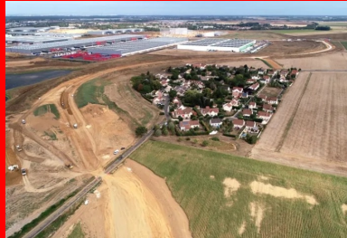
Vue aérienne du chantier du barreau sud de contournement du hameau d'Ourdy. Il permettra de relier les communes de Moissy-Cramayel et de Réau à Savigny-le-Temple.

Implanté le long de l'autoroute A5, à Réau, au nord de Melun (Seine-et-Marne), le parc d'activités de l'A5-Sénart est promis à un bel avenir. Pour renforcer sa voirie de liaison, l'établissement public d'aménagement Sénart (EPA Sénart), maître d'ouvrage, a choisi, sur proposition du bureau d'études Ségic Ingénierie, la solution du traitement de sol au liant hydraulique routier (LHR), couplée avec un recyclage des matériaux pour réaliser les travaux de terrassement de la liaison Réau-Ourdy. Un chantier d'avenir, écologiquement exemplaire, réalisé par l'entreprise Routes & chantiers modernes (RCM).