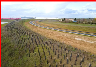
La nouvelle voie a été ouverte à la circulation en mars 2021. Ses aménagements paysagers permettent au nouveau tronçon de se fondre harmonieusement dans le paysage local.