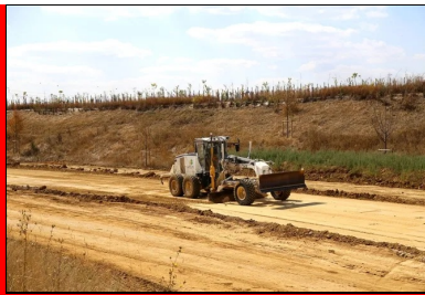
Phase très importante, la recoupe finale garantit un bon réglage.

Le traitement de la couche de forme est suivi de l'opération de compactage . L'atelier de compactage se compose de deux compacteurs vibrants V5 et d'un compacteur à pneus. Il effectue 8 passes à 2,5 km/h, travaillant en parallèle, et 6 passes de P3 sur la couche traitée, dont 2 sur l'enduit de cure .