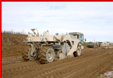
Le malaxage a été effectué à l'aide de la stabilisatrice Wirtgen 2400. Pour s'assurer de la bonne interface PST-CDF, 1-2 cm du traitement de la PST a été systématiquement repris.