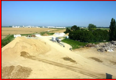
La zone de stockage de la plate-forme avec différents matériaux (sables, gravillons, déblais...).

Ensuite, pour réaliser la couche de forme, il a fallu, dans un premier temps, acheminer les matériaux recyclés et prétraités à la chaux provenant de la plate-forme de revalorisation de RCM, sise à Montereau-sur-le-Jard ; et dans un second temps, mener l'opération de mise en œuvre du matériau sur 40 cm, pour une épaisseur finale de 35 cm, afin de tenir compte du compactage et de la recoupe finale. Cette phase est très importante, car un bon réglage ne peut être garanti que s'il y a une recoupe de la couche après traitement. Aucun apport n'est possible dans la phase de réglage. « Une étape clé a été la parfaite humification du matériau. Pour obtenir une teneur en eau optimale, nous avons employé une arroseuse à enfouissement (20 l/m 2 ), puis réalisé un malaxage d'homogénéisation au malaxeur , et ce préalablement aux opérations de traitement de la couche », explique Laurent Simon.