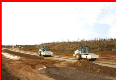
Les deux compacteurs VS de l'atelier de compactage.