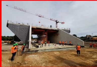
Une fois la brèche créée dans le remblai ferroviaire, le parcours de ripage a été scalpé à la bonne cote, afin de permettre à l'ouvrage de glisser sans effort excessif. Le ripage proprement dit a alors pu se dérouler : huit heures ont été nécessaires pour faire parcourir au pont-rail de quelque 6 500 tonnes les 49 mètres qui le séparaient de son emplacement définitif.