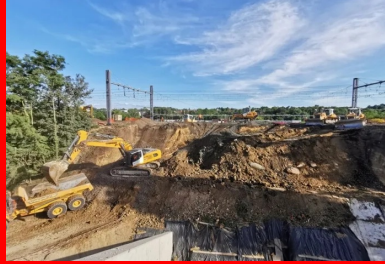
L'une des premières actions de l'opération coup de poing (OCP) a consisté à créer dans le remblai ferroviaire la brèche nécessaire à l'insertion du pont-rail. 13 000 m 3 de terre ont ainsi été déblayés en 24 heures.

Ce coulage stratégique a, par chance, été réalisé deux jours avant le premier confinement : « Le 17 mars au matin, nous fermions le chantier pour un mois complet. Miravril, lorsque nous avons repris, nous devions absolument rattraper le retard – et réaliser les travaux en un mois au lieu de deux – car les dates du ripage n'étaient pas déplaçables ! » C'est ainsi que l'entreprise a dû mettre les bouchées doubles. Le chantier a repris sur deux postes, y compris les samedis et jours fériés. Pour gagner du temps, plusieurs modifications méthodologiques ont été proposées à SNCF Réseau. Ainsi, les murs de fermeture des travées d'approche (10 m par 10 m) devaient initialement être coulés en place. « Pour gagner du temps, nous avons projeté du béton par voie sèche à prise rapide agréé par la direction de l'ingénierie de la SNCF. » Ce procédé sans coffrage, habituellement mis en œuvre pour les soutènements ferroviaires provisoires ou définitifs, permettait d'obtenir des résistances à la compression très importantes dès 8 heures de prise. « Par ce choix, nous avons gagné deux semaines de travail », assure Ludovic Ayma. Et terminé l'ouvrage à temps pour l'OCP.