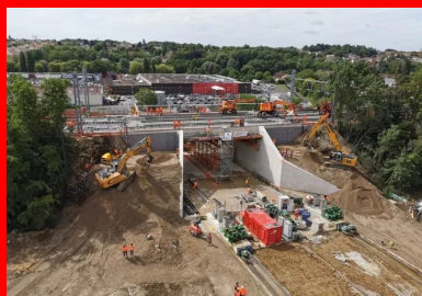
Une fois le pont-rail dans sa position définitive, la plateforme ferroviaire, déjà préchargée sur l'ouvrage (ballast et panneaux de voies), a été raccordée aux plateformes en attente de part et d'autre de la brèche. Parallèlement, les derniers remblaiements latéraux ont été effectués. Finalement, l'OCP s'est achevée avec une heure d'avance sur le planning !

La totalité des bétons des structures, provisoires ou définitives, a été réalisée avec une formulation unique répondant aux normes et prescriptions très strictes imposées par SNCF Réseau. Il s'agit d'un béton de classe de résistance C35/45 résistant aux sels de déverglaçage (classe d'exposition XD3), formulé à base d'un ciment de type CEM III. « Ce type de ciment, qui contient une plus faible proportion de clinker, limite la montée en température au cœur du matériau lors de la prise du béton. Cela permet de maîtriser les risques d'apparition des réactions sulfatiques internes, qui peuvent créer à terme des désordres structurels », détaille Ludovic Ayma. Afin d'éviter une autre pathologie potentielle du béton, le phénomène d'alcali-réaction, les granulats du béton ont par ailleurs été sélectionnés à l'issue d'études en amont afin de limiter la présence de silice réactive.