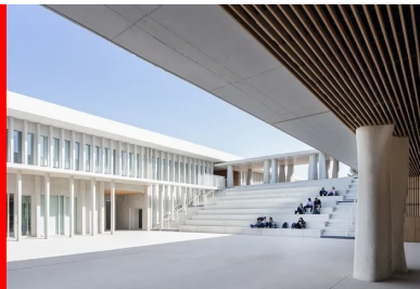
À l'opposé du hall, des emmarchements toute largeur constituent un amphithéâtre en plein air, comme une agora.