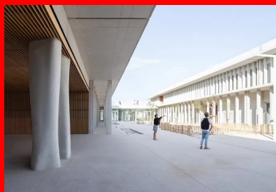
À l'extérieur, le minimalisme confère au projet sa dimension sculpturale et plastique et offre aux lycéens un cadre propice à l'apprentissage et à leur épanouissement.

Depuis le hall, les piliers se poursuivent et ceinturent l'espace de la cour intérieure. À l'opposé du hall, des emmarchements toute largeur constituent un amphithéâtre en plein air, comme une agora. Toutes ces séquences urbaines accompagnent les élèves dans leur cheminement vers la citoyenneté. Les usagers sont mis dans plusieurs situations urbaines qui reprennent les archétypes de nos villes méditerranéennes. C'est un lycée qui finalement renoue avec l'Antiquité et le lycée d'Aristote, où l'on ne pouvait apprendre qu'en marchant et en échangeant.