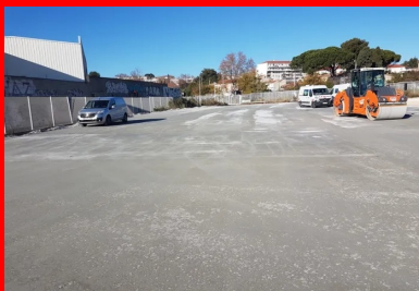
Le BCR acquiert rapidement une stabilité structurelle autorisant le stationnement des véhicules légers