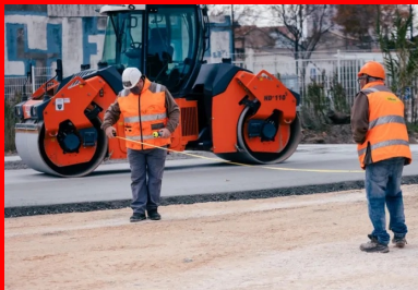
Pendant que la première couche de la première bande de BCR est compactée par un VT2, l'entreprise effectue les mesures pour positionner une nouvelle bande en respectant le plan de bétonnage en peigne.