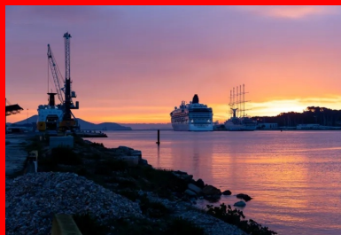
Vue générale du port de Brégaillon et de la baie de Toulon (© Vicat).

Performances techniques, durabilité, optimisation structurelle, préservation des ressources, réduction des coûts, protection de l'environnement, remise en circulation rapide... Autant d'avantages qui expliquent l'engouement pour la technique du béton compacté routier (BCR) ! En voici un nouvel exemple avec la plate-forme de stockage de véhicules en transit, réalisée sur le site du Comptoir général maritime varois (CGMV) du port de Brégaillon, à La Seyne-sur-Mer.