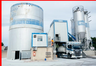
Centrale Béton VICAT où le BCR a été étudié pour optimiser sa formulation et fabriqué