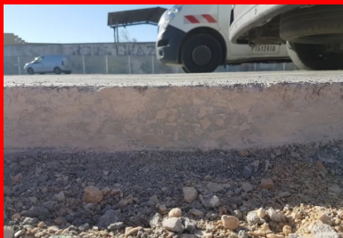
Pour la reprise de bétonnage, le joint de construction est scié proprement sur toute l'épaisseur de la couche de BCR puis humidifié. On voit bien la qualité de compactage (homogénéité et compacité) obtenue sur toute la hauteur de la couche.