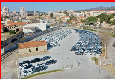
Vue aérienne de la plate-forme de stockage des véhicules en transit sur le Port de Brégaillon.

Vidéos, Guides techniques, organisation de Journées techniques, découvrez les outils mis à votre disposition sur : www.infociments.fr/routes/