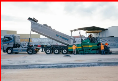
Un camion-benne, bâché, durant le transport du BCR, déverse le matériau dans le finisseur. Celui-ci répand, nivelle et compacte le BCR.

Le BCR est ensuite acheminé depuis la centrale jusqu'au chantier, par camions à semi-benne. « Comme le BCR est très sensible aux variations de la teneur en eau, les camions sont équipés de bâches pour réduire l'évaporation de l'eau du matériau sous l'effet des conditions climatiques », ajoute Olivier Piselli.