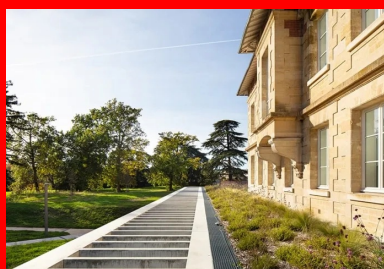
Seul témoin de la présence d'une construction semi-enterrée, le claustra de béton qui ceinture l'extension.

Les surfaces restantes, en périphérie de l'extension, bénéficient également d'un éclairage généreux de type cour anglaise et sont occupées par les salles de soin, des bureaux et les locaux du personnel.