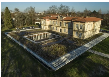
Avec sa toiture végétalisée, l'extension semi-enterrée se fond dans le parc paysager.

Conscients de l'image positive véhiculée par le « château » et de sa représentation dans l'imaginaire collectif, les architectes chargés de la rénovation et de l'extension de l'établissement ont pris le parti de la discrétion et de l'effacement pour mettre l'accent sur la valorisation de l'existant et son aspect patrimonial. Ils ont minimisé l'impact sur le parc en conservant le plus grand nombre d'arbres. Pour préserver l'intégrité architecturale du château, ils ont démolis les édifices accolés au fil du temps. Débarrassé de ces éléments parasites, le bâtiment retrouve sa position d'élément dominant.