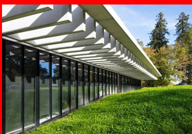
Les modelés de terrain permettent aux locaux de bénéficier de lumière naturelle en préservant l'intimité des occupants.

Ces différents éléments en béton, non porteurs, agrémentent l'extension d'une modénature résolument contemporaine, élégante et discrète qui dialogue parfaitement avec la typologie architecturale du château – une passerelle réussie entre passé et présent. À l'instar de la corolle périphérique, tous les ouvrages en béton ont été coulés en place. Si la structure porteuse de l'extension, de type poteaux-poutres avec voiles de contreventement, ne présente aucune difficulté technique, sa partition modulaire permet d'offrir des locaux qui sont facilement modulables et transformables en fonction des besoins de l'institution, toujours évolutifs.