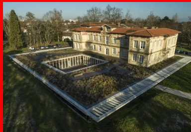
Avec sa toiture végétalisée, l'extension semi-enterrée se fond dans le parc paysager.

Conscients de l'image positive véhiculée par le « château » et de sa représentation dans l'imaginaire collectif, les architectes chargés de la rénovation et de l'extension de l'établissement ont pris le parti de la discrétion et de l'effacement pour mettre l'accent sur la valorisation de l'existant et son aspect patrimonial. Ils ont minimisé l'impact sur le parc en conservant le plus grand nombre d'arbres. Pour préserver l'intégrité architecturale du château, ils ont démolé les édifices accolés au fil du temps. Débarrassé de ces éléments parasites, le bâtiment retrouve sa position d'élément dominant.