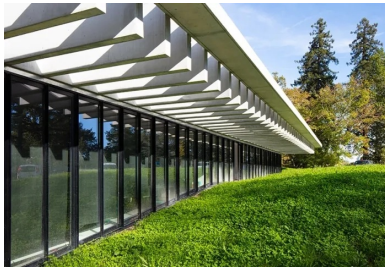
Les modelés de terrain permettent aux locaux de bénéficier de lumière naturelle en préservant l'intimité des occupants.

Ces différents éléments en béton, non porteurs, agrémentent l'extension d'une modénature résolument contemporaine, élégante et discrète qui dialogue parfaitement avec la typologie architecturale du château – une passerelle réussie entre passé et présent. À l'instar de la corolle périphérique, tous les ouvrages en béton ont été coulés en place. Si la structure porteuse de l'extension, de type poteaux-poutres avec voiles de contreventement, ne présente aucune difficulté technique, sa partition modulaire permet d'offrir des locaux qui sont facilement modulables et transformables en fonction des besoins de l'institution, toujours évolutifs.