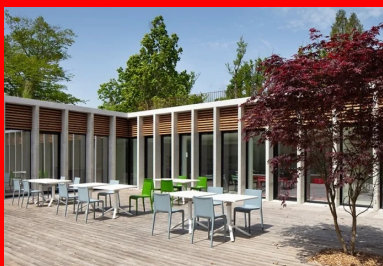
Lignes épurées et duo bois-béton créent un patio qui respire le calme et la sérénité.

Côté gestion des performances énergétiques, l'extension est conforme à la RT 2012 et le château à la RT rénovation élément par élément. Faire le choix d'une extension semi-enterrée répondait parfaitement à la volonté de discrétion du projet tout en présentant un autre avantage aussi intéressant. Elle profite ainsi de l'inertie du sol et de la toiture intensément végétalisée pour diminuer les déperditions thermiques. Cette stratégie passive apporte une grande inertie – à laquelle participe le béton –, renforcée par la mise en œuvre d'une isolation par l'extérieur qui permet de traiter la majorité des ponts thermiques. Le confort visuel n'est pas en reste avec une optimisation de l'éclairage naturel et une prédominance des surfaces vitrées. En plus des éléments d'architecture en béton faisant office de brise-soleil, des protections solaires mobiles équipent tous les locaux à occupation prolongée qui permettent de limiter les surchauffes en été et de profiter des apports gratuits d'énergie solaire en hiver. Finalement, ce projet global de rénovation et d'extension a réussi à prendre en compte les besoins spécifiques des utilisateurs tout en mettant en valeur le patrimoine existant servi par une architecture épurée et atemporelle, justement implantée et dimensionnée.