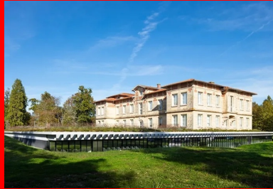
L'extension forme un socle semi-enterré qui met en valeur le château Lafon.

Dans un magnifique espace boisé, la mise en valeur d'un patrimoine existant par l'adjonction d'une extension semi-enterrée aussi moderne que discrète.