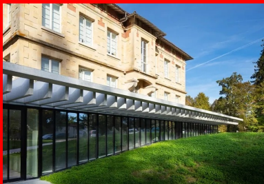
Posées en porte-à-faux, les lamelles de béton de la corolle périphérique protègent la façade vitrée des rayons solaires.

Dans ce projet de rénovation, tout a été fait pour mettre en valeur le château Lafon, et notamment la corolle de béton qui borde l'extension semi-enterrée. Cette ceinture ajourée fonctionne sur deux côtés comme un large claustra posé en porte-à-faux. Rivetée à la dalle de couverture, elle se compose de bandes de béton coulées en place et espacées de 50 cm. Ces lamelles créent une ligne dentelée qui forme un socle graphique sur lequel le volume du château semble avoir été posé, à la manière d'un plateau dont la modénature, sobre et hors du temps, ne pouvait que mettre en valeur celle d'un bâtiment de 1920.