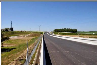
Traitement des loess et des lehms pour les travaux de terrassements du contournement ouest de Strasbourg