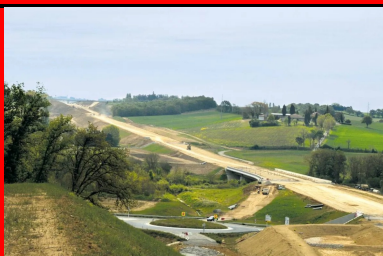
Déviation de Gimont : une couche de forme traitée au LHR