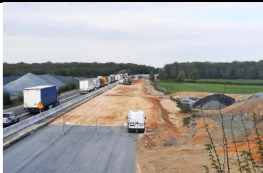
Traitement des sols pour les travaux de terrassement de l'A79, entre Toulon-sur-Allier et Digoin