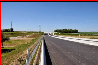
Traitement des loess et des lehms pour les travaux de terrassements du contournement ouest de Strasbourg