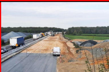
Traitement des sols pour les travaux de terrassement de l'A79, entre Toulon-sur-Allier et Digoin