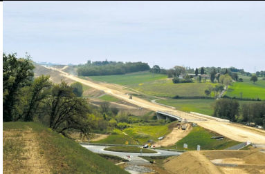
Déviation de Gimont : une couche de forme traitée au LHR