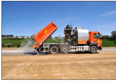
Protection de la couche de forme avec un enduit GLG.

Enfin, un enduit GLG (cloutage plus enduit monocouche) a été appliqué pour protéger la couche de forme et pour assurer la bonne prise hydraulique du mélange. À noter que la circulation des véhicules sur la couche traitée a été neutralisée pendant un délai de quatorze jours, pour ne pas rompre la prise hydraulique.