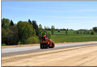
Protection de la couche de forme avec un enduit GLG.