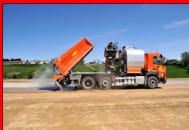
Protection de la couche de forme avec un enduit GLG.

Enfin, un enduit GLG (cloutage plus enduit monocouche) a été appliqué pour protéger la couche de forme et pour assurer la bonne prise hydraulique du mélange. À noter que la circulation des véhicules sur la couche traitée a été neutralisée pendant un délai de quatorze jours, pour ne pas rompre la prise hydraulique.