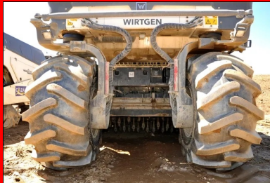
Un malaxeur Wirtgen WR 240i avec injection d'eau dans la cloche a permis le malaxage du matériau et du LHR.