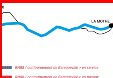
Programme d'aménagement de la RN88 entre Albi et Rodez.

Au total, l'opération qui comprend le tronçon Saint-Jean - La Mothe et la déviation de Baraqueville représente un montant d'investissement contractualisé de 240 M€, dont 230 M€ inscrits au plan de développement et de modernisation des itinéraires (PDMI) et au contrat plan état-région (CPER) 2015-2020, selon la clé de financement suivante :