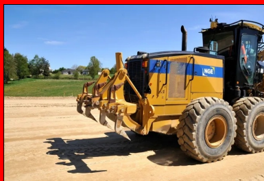
Avant épandage du LHR, le matériau est scarifié.

Le chantier s'est poursuivi avec les travaux de l'arase. Après la scarification, le LHR Rolac Optimum de Sète a été épandu et le malaxage du matériau et du LHR, sur une épaisseur de 35 cm, a commencé. Les deux natures de sols ont imposé deux dosages différents : 2 % au nord du projet (faciès gneissique) et 3 % sur le tiers sud (faciès schisteux). Un réglage avec une niveleuse équipée d'un GPS puis un compactage à l'aide d'un compacteur V5 ont été ensuite effectués. « Lors du compactage, notamment en fin d'atelier, nous avons dû redoubler de vigilance, car le schiste est un matériau qui a tendance à feuilletter », souligne Quentin Goaper. L'objectif final était d'atteindre AR2.