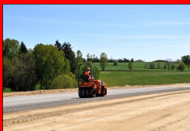
Protection de la couche de forme avec un enduit GLG.