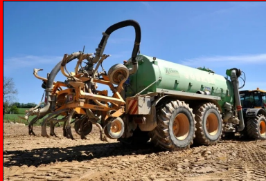
L'arroseuse à enfouissement garantit une teneur en eau optimale.