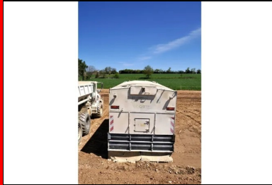
Un épandeur asservi avec contrôle pondéral a été utilisé pour l'épandage du LHR Rotac Premier à la surface du matériau.