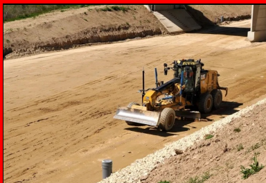
Réglage à la niveleuse pour obtenir un profil en long très régulier.

Cette opération a été suivie du traitement proprement dit, réalisé en deux étapes :