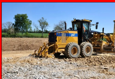
Avant épandage du LHR, le matériau est scarifié.