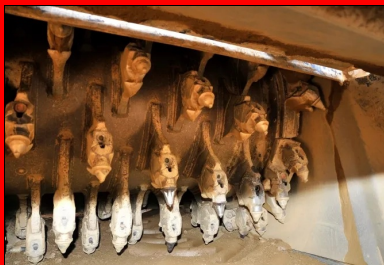
Un malaxeur Wirtgen WR 240i avec injection d'eau dans la cloche a permis le malaxage du matériau et du LHR.