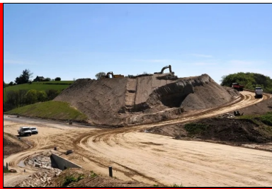
Les matériaux sont repris sur le stock à l'aide d'une pelle sur chenilles et de tombereaux articulés, puis mis en œuvre sur 40 cm par des bulis assistés par GPS.