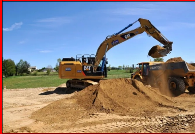
Les matériaux sont repris sur le stock à l'aide d'une pelle sur chenilles et de tombereaux articulés, puis mis en œuvre sur 40 cm par des bulis assistés par GPS.