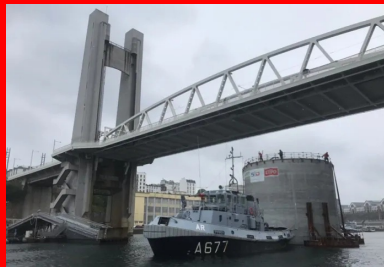
Passage du convoi du musoir sous le célèbre pont de Recouvrance. Afin de pouvoir passer le seuil du bassin n° 4, le musoir a été flanqué de flotteurs additionnels durant le remorquage, ce qui limite son tirant d'eau.

La réalisation du musoir, cylindre de 14 m de diamètre et 23 m de haut, a été menée parallèlement à celle du ponton. Après le coulage du radier de 80 cm d'épaisseur, ses voiles courbes de 40 cm d'épaisseur en partie courante ont été coulés à l'aide d'un coffrage glissant sur six jours en continu, au rythme de 20 cm par heure. « Cette opération intensive, menée par 40 personnes mobilisées 24 h/24, a été minutieusement préparée en amont, notamment pour assurer le bon cadencement des camions-toupies, qui devaient livrer 4 m 3 /heure. »