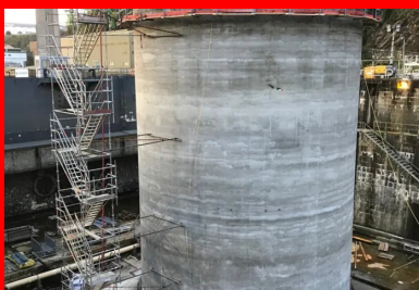
Encastré dans un radier de 80 cm d'épaisseur, le voile circulaire du musoir (40 cm d'épaisseur) a été érigé à l'aide d'un coffrage glissant sur toute sa hauteur (22,2 m). Le coulage du voile a été mis en œuvre en continu sur six jours par une équipe de 40 personnes mobilisées 24 h/24. Cette continuité permettait de limiter les reprises de bétonnage, qui constituent des zones de fragilité, notamment vis-à-vis de l'étanchéité du parement.

Perpendiculaire au quai, le ponton est solidement amarré à chacune de ses extrémités à des points fixes, par l'intermédiaire de chaînes métalliques : côté quai, sur des massifs en béton armé fondés sur des micropieux ; côté mer, sur un musoir cylindrique en béton armé posé sur le fond marin. Sur le ponton, les quatre points d'ancrage de la chaîne sont constitués d'amortisseurs conçus pour reprendre les efforts d'accostage et les efforts d'amarrage. « Lorsque le ponton est chahuté par une mer agitée, les amortisseurs permettent de réduire les efforts d'amarrage. Néanmoins, cette réduction suppose qu'eux-mêmes puissent encaisser des charges importantes. C'est pourquoi les amortisseurs sont fixés sur des socles en béton très fortement armé – de l'ordre de 350 kg d'armature par mètre cube de béton, contre une moyenne de 200 kg/m 3 pour le reste de l'ouvrage », précise Emmanuel Starksen, directeur général délégué d'ETPO, cotraitant du groupement de génie civil piloté par l'entreprise Charier.