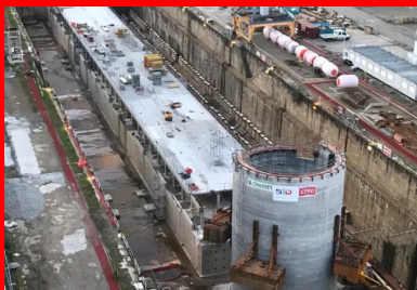
Le ponton (160 m de long, 17 m de large et 9 m de hauteur) et le musoir (23 m de haut et 14 m de diamètre) ont été construits au sec dans le bassin n° 4 de la base navale de Brest, mis à disposition par le maître d'ouvrage. Les dimensions de cette forme de radoub étaient suffisantes pour pouvoir ériger simultanément les deux ouvrages.

Navires militaires de combat, les frégaes multi-missions (FREMM) se caractérisent par leur polyvalence : leurs capacités anti-sous-marines, anti-navires et anti-aériennes en font de redoutables adversaires, capables d'atteindre des cibles en mer comme à terre. Si elles disposent d'une grande autonomie et d'une grande endurance, elles doivent néanmoins faire des escales régulières pour se ravitailler en carburant, en vivres et assurer le débarquement/embarquement des marins. Pour cela, les six FREMM françaises peuvent compter sur les appontements des bases navales de Toulon et de Brest. Suite à la mise en service d'un premier ponton d'accostage flottant en 2013, le port militaire de Brest s'est doté en avril 2021 d'une seconde ligne.