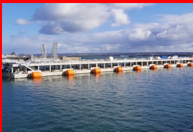
Vue générale du ponton flottant, de la passerelle métallique de liaison au quai (à gauche) et du musoir (à droite), qui constitue le point fixe d'accostage et d'amarrage des frégaes côté mer.

La base navale de Brest s'est récemment dotée d'un nouvel appontement pour accueillir les frégaes multi-missions de la Marine nationale. L'ouvrage se distingue par son originalité : il s'agit d'un ponton flottant en béton armé aux dimensions XXL : 160 m de longueur, 17 m de largeur pour 9 m de hauteur. Entre planning serré, logistique contrôlée et hautes exigences de qualité, sa construction, dans une cale sèche de la base militaire, a imposé de relever de nombreux défis au groupement d'entreprises de génie civil. Récit.