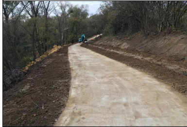
Travaux de mise à niveau des accotements associés aux travaux de stabilisation des berges.