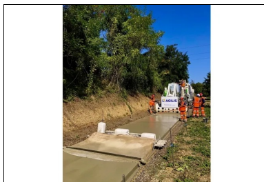
La machine à coffrages glissants, tractant la toile de jute, assure simultanément la réalisation du revêtement en béton et le traitement de surface.