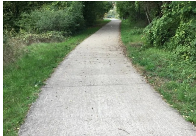
La promenade cyclable en béton s'étire désormais sur 30 km de long.

La communauté de communes Rives de Moselle (57) a inauguré, le 9 octobre 2021, deux nouveaux tronçons, situés entre Richemont et Gandrange, de la piste cyclable du Fil bleu de l'Orne. Totalisant une longueur de 6,5 km, avec une largeur de 2,50 m, ces deux extensions ont été réalisées en 2020 et en 2021 par AGILIS, en groupement avec Muller TP, mandataire pour les terrassements et les préparations. Ces deux filiales du groupe NGE ont collaboré en cotraitance avec Stradest, sous la maîtrise d'œuvre du cabinet BEA. Ces deux projets, conçus avec un revêtement en béton, ont nécessité la fabrication et la livraison de 2 000 m 3 de béton par EQIOM, à partir de ses centrales d'Illange (centrale principale) et de Metz-Borny (centrale de secours).