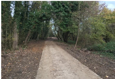
La piste cyclable s'intègre parfaitement dans le paysage naturel de la vallée de l'Orne.

La coordination entre AGILIS et EQIOM a été ajustée au plus fin pour produire, sans rupture, 1 500 m 3 de béton C30/37 XF2. Outre ces cadences et les problèmes d'accès connus dans certaines zones par les toupies, le suivi de la qualité du béton prêt à l'emploi a été aussi mené avec soin : « On nous demandait une résistance au fendage de 2,4 MPa au minimum et nous avons dû nous caler correctement pour obtenir la bonne plasticité et pour que le béton se mette en place facilement. C'est un chantier imposant : il est rare, en effet, de réaliser des voies en béton de cette ampleur », poursuit Alain Marcus.