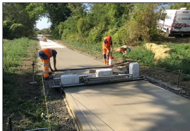
Derrière la toile de jute, la protection du béton est assurée par la pulvérisation d'un produit de cure.

« Le bétonnage a été effectué en grande partie à l'aide d'une machine à coffrages glissants guidée sur fils (deux fils, un fil de chaque côté) et tractant une toile de jute », ajoute Alain Quiévreux.