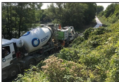
Le béton fabriqué à la centrale d'Illange d'EQIOM est livré par camions-toupies devant la machine à coffrages glissants.

Le bétonnage a été conduit de façon mécanisée. En effet, sur la majeure partie du tracé entre les communes de Richemont et de Gandrange, une machine à coffrages glissants équipée d'un moule de type « chaussée » a été utilisée. Les endroits les moins accessibles (d'une largeur insuffisante pour le passage de la machine), qui représentaient 5 % du linéaire, ont été traités de façon manuelle. Dans ce cas, le bétonnage a été réalisé entre coffrages fixes et le béton de formulation spécifique ( consistance S3 ) a été tiré manuellement à la régle vibrante .