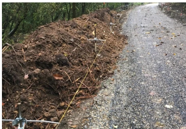
Couche de forme avec enduit de protection prête à recevoir le revêtement en béton. Fils de guidage de la machine à coffrages glissants déjà en place.

Le béton a été fabriqué et livré par EQIOM, à partir de sa centrale BPE d'Illange. Le béton a été ensuite acheminé depuis la centrale jusqu'au chantier par camions-toupies, qui déversent le béton devant la machine à coffrages glissants. « Le chantier a parfois nécessité l'emploi d'une pompe ou même d'un girabenne pour parvenir à alimenter, dans de bonnes conditions, la machine à coffrages glissants », précise Alain Quiévreux, conducteur de travaux chez AGILIS.