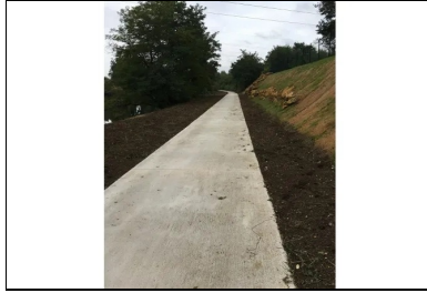
Après la réalisation des joints et leur garnissage, les travaux de mise à niveau des accotements débutent.