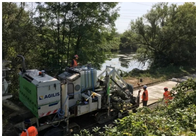
Le nouveau tronçon de la promenade cyclable Fil bleu des Berges de l'Orne en cours de réalisation.