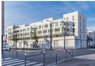
À l'est, sur la rue d'Artik, le bâtiment collectif forme un front urbain et répond au gabarit de l'immeuble qui lui fait face. © Rue Royale

Située sur la rive gauche du Rhône, la ville de Vaulx-en-Velin fait partie de la banlieue est de Lyon. Au nord de la commune, la Métropole de Lyon aménage la ZAC de la Grappinière en quartier résidentiel, afin de transformer et renouveler l'image du lieu. L'opération « Entre deux », de l'agence d'architecture Rue Royale, s'inscrit dans cette perspective avec un projet mixte d'habitat collectif et intermédiaire, complété par des locaux d'activités. Il est implanté sur une parcelle précédemment occupée par un ancien centre commercial. Un tiers de la surface du terrain est aménagé en jardin public. En relation avec une grande place végétalisée au nord-est, il ancre les logements dans la trame verte du quartier et les différentes échelles urbaines. À l'est du site, sur la rue d'Artik, une autre opération neuve de logements en R+5 compose un front bâti continu, avec des commerces en rez-de-chaussée. De l'autre côté, à l'ouest, le long de la rue du Général Delestraint, le nouveau jardin de la Grappinière crée une transition avec le grand ensemble existant.