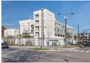
L'immeuble collectif et les maisons en bande s'organisent sur un socle actif, qui abrite des stationnements fermés et des locaux commerciaux.

Sur un socle, maisons de ville et logements collectifs s'organisent autour d'un jardin suspendu dans cette opération originale, qui renouvelle l'image du quartier.