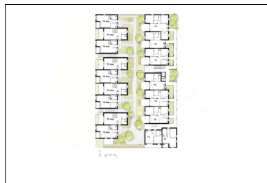
Plan du R+1 et du jardin suspendu