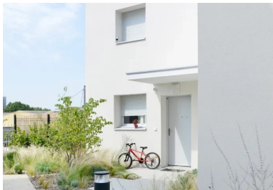
Les maisons en bande ont toutes leur entrée de plain-pied avec le jardin suspendu. SPIRIT