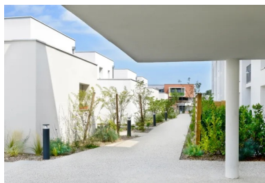
Sur le socle, l'espace commun entre l'immeuble collectif et les maisons en bande est aménagé comme un jardin suspendu. SPIRIT

Le socle, les planchers, les voiles de refend et les poteaux sont en béton brut de parement lisse coulé en place . Les parties visibles sont recouvertes d'une lasure blanche . Les façades sont réalisées en blocs de béton cellulaire qui participent à la bonne isolation des logements. Ils permettent également une simplicité et une rapidité de mise en œuvre. Une planelle en béton cellulaire avec un isolant thermique est posée au niveau des nez de dalles de planchers, afin de supprimer les ponts thermiques. À l'extérieur, les blocs sont revêtus d'un enduit minéral et, côté intérieur, ils reçoivent une isolation thermique complémentaire. Dans chaque logement, le chauffage et la production d'eau chaude sanitaire sont assurés par un module thermique d'appartement relié à une sous-station connectée au réseau de chauffage urbain. L'opération répond aux exigences de la RT 2012 - 20 %.