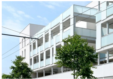
La desserte des appartements de l'immeuble collectif se fait par un système de coursives en balcon sur la rue d'Artik. SPIRIT © Photo Aline Périer

L'accès à tous les logements se fait par une entrée unique depuis la rue d'Artik, qui dessert également le jardin commun suspendu conçu par L'Atelier du Bocal. Une grande diversité d'essences, d'arbres, d'arbustes compose ce jardin et en fait un lieu d'agrément, de rassemblement, de respiration, offert aux habitants. Un système de coursives, en balcon sur la rue d'Artik, assure la desserte des appartements de l'immeuble collectif. Ces coursives sont mises à distance du volume bâti, pour éviter d'avoir des vues directes sur les logements depuis les circulations collectives et maintenir ainsi l'intimité des habitants. Les appartements sont reliés à la coursive par leur propre passerelle, qui marque une transition et individualise chaque entrée. Des plantes grimpantes sont disposées en pleine terre au premier étage. Elles ont pour objectif de créer un filtre entre circulations collectives et logements tout en végétalisant la façade .