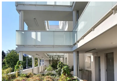
Les coursives sont mises à distance du volume bâti, pour éviter d'avoir des vues directes sur les logements.

Les maisons en bande se répartissent selon deux typologies croisées, traversantes et en duplex. Elles ont toutes une entrée de plain-pied avec le jardin suspendu qui dessert les pièces de vie des logements. Les T4 s'élèvent avec les chambres à l'étage. Tandis qu'à l'inverse, les chambres des T5 se creusent dans le socle actif. Elles s'ouvrent sur le jardin public légèrement en contrebas, tout en gardant une certaine hauteur par rapport à celui-ci.