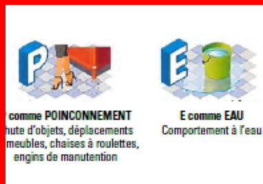
Les critères du classement UPEC

A chaque partie de catégorie d'ouvrage correspond un classement selon les 4 critères ci-dessous.