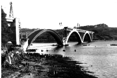
Reconstruction de l'une des arches, démolie pendant la seconde guerre mondiale, à l'aide d'un cintre similaire au cintre d'origine.

Une fois le cintre libéré, il était débridé et déplacé jusqu'à l'emplacement de l'arche suivante, où la même cinématique de pose était reproduite. Les trois arcs en place, restait alors à construire les pilettes intermédiaires et le double tablier - dont le tablier supérieur, encastré dans l'épaisseur des arcs à la clé, permettait d'abaisser le niveau de la chaussée d'environ 4 m, ce qui facilitait le raccordement en rive.