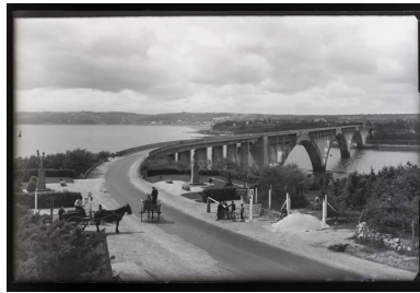
Jusqu'en 1994, année de mise en service du pont voisin de l'Iroise, le pont Albert-Louppe permettait la traversée des voitures automobiles...ou à cheval !