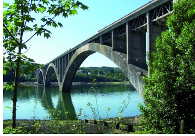
L'ouvrage, aujourd'hui toujours debout, est considéré comme un héritage somptueux de l'âge d'or du béton armé.

Bientôt centenaire, le pont Albert-Louppe avec ses trois arches en béton armé de 186 m de portée constitue un témoignage extraordinaire du génie de son concepteur, Eugène Freyssinet.