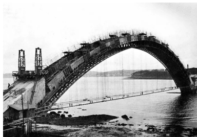
Bétonnage par plots du premier arc.

Eugène Freyssinet, concepteur du pont Albert-Louppe