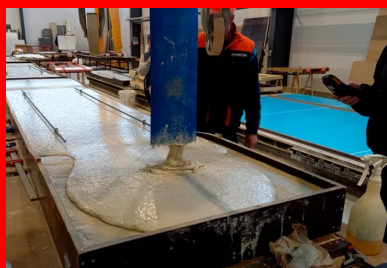
Préfabrication des dalles. Le BFUP est coulé dans des moules en polyuréthane.

Sa construction date de 1834, époque durant laquelle une longue sécheresse tarit la plupart des sources et puits de la Cité phocéenne, compromettant les cultures et les élevages. La décision de la réalisation d'un aqueduc sur les communes de Ventabren et Aix-en-Provence est prise. Franz Mayor de Montricher, jeune ingénieur des Ponts et Chaussées, en dresse les plans et en conduit les travaux. « Montricher a fait le choix de l'archaïsme en construisant un aqueduc en maçonnerie de pierres à l'ère des ouvrages métalliques », précise Laurent Deloince, chargé des opérations à la direction de l'Eau, de l'Assainissement et du Pluvial de la Métropole.