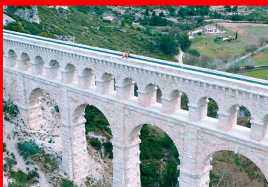
Construit en 1834, cet édifice patrimonial est aujourd'hui l'un des derniers aqueducs en activité.

Le tablier supérieur de cet ouvrage classé monument historique alimente en eau la métropole marseillaise. Il est dorénavant protégé par une couverture en BFUP.