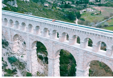
Construit en 1834, cet édifice patrimonial est aujourd'hui l'un des derniers aqueducs en activité.

Le tablier supérieur de cet ouvrage classé monument historique alimente en eau la métropole marseillaise. Il est dorénavant protégé par une couverture en BFUP.