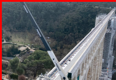
Approvisionnement des dalles sur le tablier supérieur.

« Le marché confié à NGE GC PACA consiste à restaurer les tabliers », explique Maxime Alarcon, conducteur de travaux chez NGE GC PACA. « Les tabliers intermédiaires, de petites dimensions, ont été revêtus de dalles en béton armé »