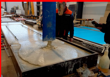
Préfabrication des dalles. Le BFUP est coulé dans des moules en polyuréthane.

Sa construction date de 1834, époque durant laquelle une longue sécheresse tarit la plupart des sources et puits de la Cité phocéenne, compromettant les cultures et les élevages. La décision de la réalisation d'un aqueduc sur les communes de Ventabren et Aix-en-Provence est prise. Franz Mayor de Montricher, jeune ingénieur des Ponts et Chaussées, en dresse les plans et en conduit les travaux. « Montricher a fait le choix de l'archaïsme en construisant un aqueduc en maçonnerie de pierres à l'ère des ouvrages métalliques », précise Laurent Deloince, chargé des opérations à la direction de l'Eau, de l'Assainissement et du Pluvial de la Métropole.