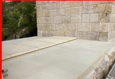
Complexe d'étanchéité sur le tablier intermédiaire.

Les travaux consistent à remplacer certaines pierres trop abimées par des blocs de calcaire identiques (près de 500 m 3 en tout), à traiter celles qui sont encore en bon état et à réaliser des étanchéités sur les tabliers afin de les protéger des eaux de ruissellement. L'étanchéité des trois tabliers est l'objet de cet article.