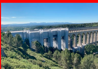
Les travaux portent notamment sur le remplacement des pierres et la réflexion de l'étanchéité sur les trois tabliers.

Il s'agit du plus haut aqueduc en pierres de taille du monde. Culminant à 83 m de hauteur, ce joyau du patrimoine provençal (375 m de long) enjambe la vallée de l'Arc, une voie ferrée et une route départementale pour acheminer l'eau de la Durance jusqu'à l'agglomération marseillaise via le canal de Marseille.