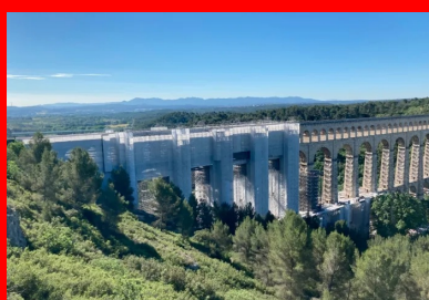
Les travaux portent notamment sur le remplacement des pierres et la réflexion de l'étanchéité sur les trois tabliers.

Il s'agit du plus haut aqueduc en pierres de taille du monde. Culminant à 83 m de hauteur, ce joyau du patrimoine provençal (375 m de long) enjambe la vallée de l'Arc, une voie ferrée et une route départementale pour acheminer l'eau de la Durance jusqu'à l'agglomération marseillaise via le canal de Marseille.