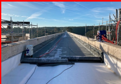
Étanchéité du tablier supérieur : les dalles en BFUP vont recouvrir la géomembrane pour la lester.

« Son objectif était de mettre en scène l'arrivée de l'eau sur le canal de Marseille au moyen d'ouvrages emblématiques. » À l'issue d'un chantier gigantesque mobilisant près de 5 000 ouvriers et 160 000 pierres de taille, l'aqueduc de Roquefavour est mis en service en 1847. Exploité par la Société Eau de Marseille Métropole (SEMM), il est aujourd'hui l'un des derniers aqueducs en activité et classé au patrimoine historique depuis 2005.