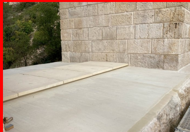
Complexe d'étanchéité sur le tablier intermédiaire.

Les travaux consistent à remplacer certaines pierres trop abimées par des blocs de calcaire identiques (près de 500 m 3 en tout), à traiter celles qui sont encore en bon état et à réaliser des étanchéités sur les tabliers afin de les protéger des eaux de ruissellement. L'étanchéité des trois tabliers est l'objet de cet article.