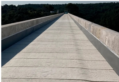
Épaisseurs de 3 cm, les dalles servent également d'espace de circulation pour les engins lors des visites d'entretien.

Pour le tablier supérieur, les enjeux sont différents : il accueille la conduite d'eau et il est beaucoup plus exposé aux intempéries. Ouvert à l'origine, busé dans les années 1970 pour éviter tout contact entre l'eau et la maçonnerie, il a ensuite été étanchéifié avec une géomembrane et des dallettes en béton . Le tout avait souffert et il était indispensable d'optimiser durablement l'étanchéité pour améliorer la maintenance. C'est pourquoi François Botton a préféré au béton armé un béton ultra-hautes performances ( BFUP ). Quatre cent soixante-dix dalles en BFUP Smart-Up [Structure +] blanc recouvrent ainsi le tablier supérieur, servant à la fois de lest pour la géomembrane de protection et d'espace de circulation pour les engins lors des visites d'entretien. Légèrement galbées, rigidifiées par deux nervures, les dalles ne mesurent que 3 cm d'épaisseur pour être maniables. « Outre la mise au point de spécificités techniques très précises, nous accompagnons le préfabricant et l'entreprise, en l'occurrence Innobéton et NGE GC PACA, dans la conception des moules et la formulation du produit le plus adapté en termes de performances mécaniques, de durabilité, d'ouvrabilité, de souplesse d'utilisation », précise Jérôme Frécon, responsable d'activité Smart-Up chez Vicat.