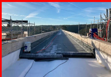
Etanchéité du tablier supérieur : les dalles en BFUP vont recouvrir la géomembrane pour la lester.

« Son objectif était de mettre en scène l'arrivée de l'eau sur le canal de Marseille au moyen d'ouvrages emblématiques. » À l'issue d'un chantier gigantesque mobilisant près de 5 000 ouvriers et 160 000 pierres de taille, l'aqueduc de Roquefavour est mis en service en 1847. Exploité par la Société Eau de Marseille Métropole (SEMM), il est aujourd'hui l'un des derniers aqueducs en activité et classé au patrimoine historique depuis 2005.