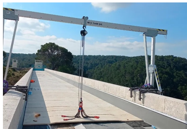
Les dalles manipulables sont posées à l'aide d'un portique roulant.

Ce choix s'est montré pérenne pendant plus de 160 ans. Mais en 2007, la SNCF signale des chutes de pierres. « Le colosse souffrait de dégradations naturelles avec des infiltrations dans les pierres, les tabliers et les joints », explique Laurent Deloince. « La Métropole a donc inscrit sa rénovation dans le cadre du schéma directeur du patrimoine à entretenir, ainsi que dans le programme pluriannuel d'investissement. Des travaux prioritaires ont commencé dès 2008 avec des cordistes qui ont effectué des opérations de purge au niveau des arches qui enjambent la voie SNCF et la RD 65. » Depuis juin 2020, l'ouvrage fait l'objet d'une rénovation globale qui durera jusqu'en janvier 2024 (44 mois) sans interrompre l'activité de l'aqueduc. Les enjeux sont de plusieurs ordres : permettre le bon fonctionnement du transport de l'eau (180 millions de mètres cubes par an) vers un bassin de population avoisinant les 1 200 000 usagers, restaurer un patrimoine dégradé et sécuriser les voies de circulation qu'il franchit. Pour ce faire, la Métropole, dont l'une des missions consiste à délivrer une eau saine à la consommation, a enclenché les études préalables et a désigné l'architecte du patrimoine François Botton lors de la consultation en 2014.