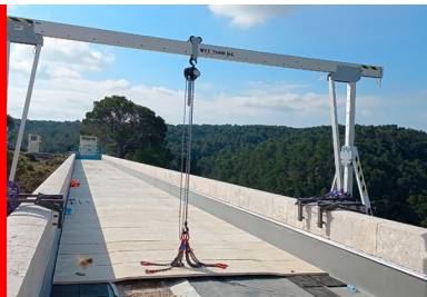
Les dalles manportables sont posées à l'aide d'un portique roulant.

Les travaux consistent à remplacer certaines pierres trop abimées par des blocs de calcaire identiques (près de 500 m 3 en tout), à traiter celles qui sont encore en bon état et à réaliser des étanchéités sur les tabliers afin de les protéger des eaux de ruissellement. L'étanchéité des trois tabliers est l'objet de cet article.