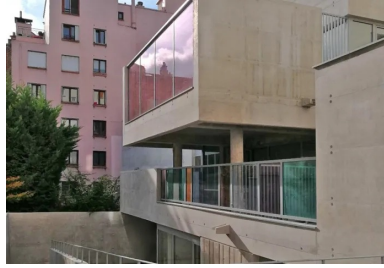
Vue sur la crèche à la sortie du passage sous porche.

Sculptée dans le béton, cette crèche offre aux jeunes enfants des espaces intérieurs lumineux et des prolongements extérieurs protégés, dont la qualité est propice à leur épanouissement.