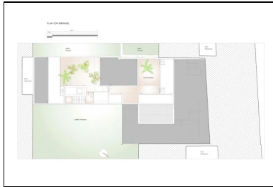
Plan de la toiture-terrasse