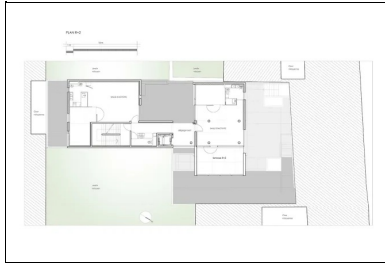
Plan du R+2