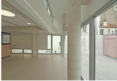
Une salle d'activité et la terrasse extérieure accessible.