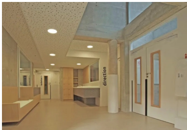
Vue sur le hall d'entrée.