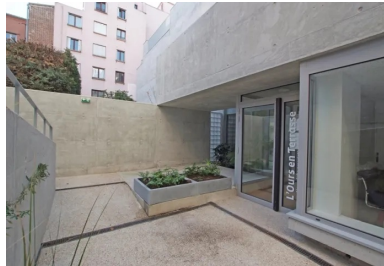
Le garde-corps de la terrasse extérieure du premier étage cadre le creux dans lequel est aménagée l'entrée de la crèche.

Conçu par les architectes Sylvie Brachet et Serge Djordjevic, un de ses établissements les plus récents, la crèche « l'Ours en Terrasse », se situe au cœur d'un îlot bordé par les rues Bretonneau, Pelleport et le Bua, dans le 20 e arrondissement de Paris. On y accède depuis le numéro 8 bis de la rue Bretonneau, par un passage sous porche traversant un immeuble de logements. Le terrain était auparavant occupé par un atelier d'imprimerie datant du début du XX e siècle, qui a fait l'objet d'une déconstruction préalable. Invisible depuis la rue, il se développe en profondeur, selon une morphologie dite en « lanière ». L'immeuble de logements sur la rue Bretonneau marque la limite nord du site. Au sud, le fond de la parcelle jouxte un bâtiment de logements des années 70, tandis que la limite ouest est bordée par un immeuble de logements et par des jardins. Enfin, à l'est, deux petits immeubles de logements à R+3, suivis d'un jardin, sont attenants au terrain.