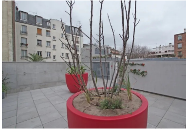
Un espace de jeux et d'activité en toiture-terrasse.