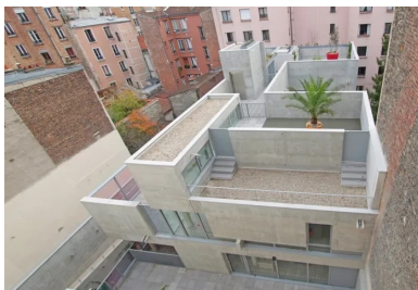
Une partie du toit-terrasse est aménagée de façon à accueillir les activités extérieures qui sont communes aux différentes sections (motricité, jeux d'éveil, etc.).

La fluidité des espaces intérieurs, la présence variée de la lumière naturelle capturée par différents dispositifs architecturaux (patios, cour, sheds...), la diversité des vues, des perspectives intérieures ou extérieures, les parcours conçus comme une promenade architecturale caractérisent et qualifient l'ambiance des lieux.