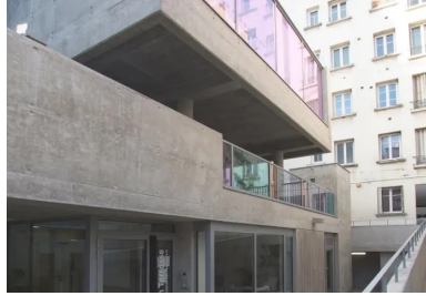
L'accès à la crèche se fait au niveau de la cour basse desservie par un ascenseur extérieur et par une rampe.

Créée en 1987, par des infirmières puéricultrices, ABC Puériculture est une association loi 1901 à but non lucratif. Spécialisée dans le secteur de la petite enfance, elle participe activement à l'effort engagé par la Caisse d'allocations familiales (Caf) et la Ville de Paris afin de répondre à la demande croissante des familles pour des places en crèche ou des solutions de garde à domicile. L'association est aujourd'hui à la tête de 24 crèches collectives dans Paris intra-muros.