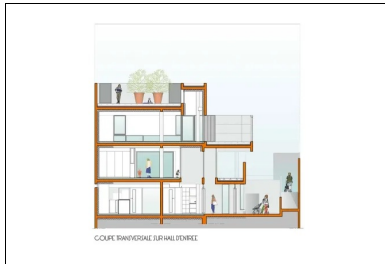
Coupe transversale sur le hall d'entrée