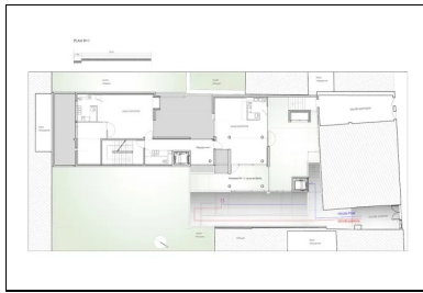
Plan du R+1