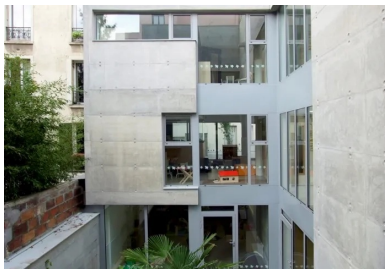
Le patio central dispense la lumière naturelle au cœur du bâtiment. Les salles d'activité du rez-de-chaussée s'ouvrent de plain-pied sur le patio.

La fluidité des espaces intérieurs, la présence variée de la lumière naturelle capturée par différents dispositifs architecturaux (patios, cour, sheds...), la diversité des vues, des perspectives intérieures ou extérieures, les parcours conçus comme une promenade architecturale caractérisent et qualifient l'ambiance des lieux.