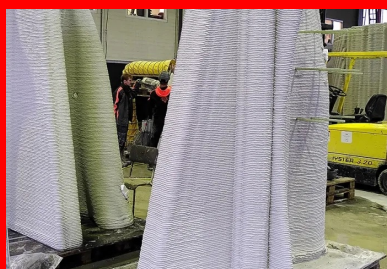
Des coques en béton imprimées 3D par dépôt de couches successives sont apposées sur la structure en béton armé pour servir de coffrage.

Le lot 4 concerne la conception et l'immersion d'un « village » de récifs artificiels. Composé d'embrochements et de plusieurs types de récifs secondaires disposés autour d'un module principal haut de trois étages, il s'étend sur plus de 1 000 m à 20 m de profondeur. L'ensemble sert à protéger l'habitat marin coralligène en déportant une partie de l'activité de plongée.