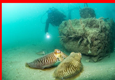
Très vite, ils ont servi de support à la flore et accueilli des œufs de calmars.

L'immersion de 34 récifs en béton réalisés en 3D n'est là que l'une des quatre opérations du projet Récif'lab porté par la ville d'Agde et mis en œuvre par l'entreprise montpelliéraine Seaboost, Lauréat en 2018 d'un programme d'investissement d'avenir, Récif'lab vise un objectif très concret : protéger et reconquérir la biodiversité marine endémique par une approche innovante.