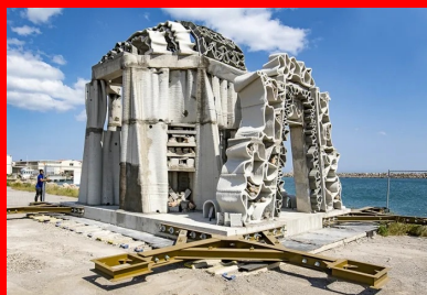
Au cœur du village de récifs artificiels, le module central mesure 6,50 m de haut sur une base de 48 m 2 .

Ecole centrale de Marseille a contribué aux études en bassin à houle pour déterminer les dimensions des modules les mieux adaptées aux conditions hydrodynamiques du site. Les lests conçus par Seaboost ont été réalisés à « l'encre 3D béton » de Vicat grâce à la technologie d'impression 3D d'XtreeE. Fabriqués à Paris, transportés à La Seyne-sur-Mer, acheminés par navire jusqu'au Cap d'Agde, les Xreef ont été immergés fin mai 2019 par l'entreprise Foselev Marine. L'ampleur du déploiement est une première mondiale, qui permet de créer un corridor écologique pérenne tout en optimisant, à moyen terme, les coûts de gestion et le bilan carbone du balisage en mer.