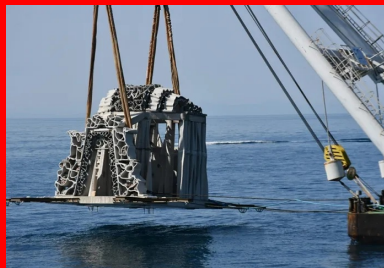
Immersion du module central au large de l'île de Brescou.

Une fois le socle ferrailé, le béton est coulé en place. Sa formulation est le fruit d'un partenariat avec Seaboost, l'université de Montpellier, Calcia et Superbloc, producteurs de béton SP5 . Elle répond à plusieurs exigences : une classe d'exposition XS2 pour tenir les chlorures marins, une faible empreinte carbone et une résistance très élevée (C60/75) pour que la dalle portante, malgré sa finesse, supporte le levage et le transport maritime. Pour ce faire, le groupement a utilisé le ciment CEMIII/A de Calcia, particulièrement résistant aux agressions chimiques en milieu marin, qui permet en outre d'améliorer à 40 % l'empreinte environnementale du béton. Il a ensuite été réalisé dans la centrale d'Assas (34) de l'entreprise Superbloc « en veillant à ce que le béton garde ses caractéristiques de fluidité S5 pendant 2 h, le temps du transport en camion malaxeur à Frontignan où se passait la mise en œuvre de la structure », comme le précise Olivier Pascal, gérant de Superbloc.