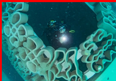
Outre ses vertus écologiques, le design de ce gigantesque récif artificiel répond aussi aux attentes des clubs de plongée.