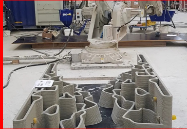
Leur design biomimétique permet d'accueillir la biodiversité marine.

Réalisé en impression 3D , le module central est un portique poteaux/poutres en béton armé dimensionné par le bureau d'ingénierie Lamoureux et Ricciotti. « La conception structurelle a été très spéciale en raison des efforts hydrostatiques et hydrodynamiques de la houle qui s'élève à plusieurs tonnes au mètre carré, soit dix à cent fois plus qu'un ouvrage de bâtiment classique, assure Romain Ricciotti. Par ailleurs, la manutention en mer est un autre facteur dimensionnant compte tenu du gabarit et des 105 t à soulever et à transporter sur barge avant l'immersion finale. »