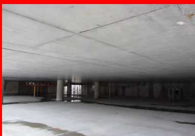
Parking Gérard Philipe - La Garde (Var). La technique des planchers précontraints par post-tension est particulièrement bien adaptée à la configuration des parkings. Les dalles plates permettent de dégager de vastes trames sans poteau (ici 15 m x 8 m), ce qui optimise la répartition des places de stationnement et la circulation des voitures. Par ailleurs, l'absence de poutre dessine des surfaces régulières facilitant le passage des réseaux et simplifiant la technique de ventilation. © FREYSSINET

Procédé inventé par le célèbre ingénieur Français, Eugène Freyssinet en 1928, le béton précontraint a révolutionné l'art et la science de la construction. Cette technique, qui augmente durablement la résistance des structures (voir encadré 1), permet notamment d'allonger les portées entre appuis ou d'affiner les éléments porteurs, en comparaison de procédés plus classiques comme le béton armé . Généralement associée aux ouvrages de génie civil, en particulier les ponts de grandes portées ou les équipements exceptionnels comme les enceintes nucléaires ou les stades, son utilisation dans le bâtiment est souvent peu connue en France.