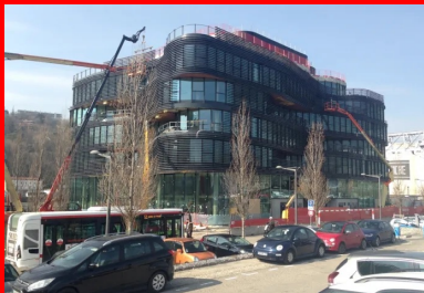
Le Pavillon 52 - situé dans le quartier Lyon Confluences (Rhône). Cet immeuble de bureaux en R+6, conçu par l'architecte Rudy Ricciotti, développe une surface de 7 700 m 2 . La technique des planchers précontraints par post-tension a été choisie par le maître d'œuvre pour au moins trois raisons : la nécessité de disposer de grands plateaux, la capacité à épouser les formes ondulantes des différents niveaux, et la possibilité d'y intégrer un système de plafond chauffant.

Ces arguments environnementaux pèsent de tout leur poids à l'heure où la réglementation environnementale RE 2020, en vigueur depuis le 1er janvier 2022, impose une limitation de l'impact carbone des bâtiments sur l'ensemble de leur cycle de vie , et notamment pendant les phases de construction et d'exploitation.