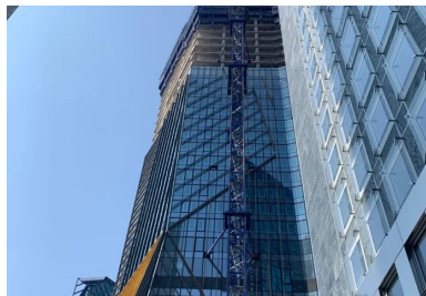
Tour Hekla - La Défense (Hauts-de-Seine, architecte Jean Nouvel). Les 46 niveaux de cette tour de 220 mètres de haut sont constitués de planchers précontraints par post-tension. Cette solution technique permettait de s'adapter à la forme unique et complexe de la tour - tous les planchers disposent d'une géométrie unique - tout en respectant les délais de construction et en diminuant l'empreinte carbone de l'ouvrage de 30 % par la réduction des quantités de béton et d'armatures d'acier. © FREYSSINET

En phase de construction, certaines étapes de mise en œuvre sont allégées - suppression des coffrages des retombées de poutre , réduction ou suppression des joints de dilatation - ou simplifiées - gestion des réservations pour les réseaux. Enfin, tout au long de la vie de l'immeuble, le maître d'ouvrage diminue ses charges d'exploitation et d'entretien. « Au final, une étude économique comparative réalisée pour chaque projet démontre la diminution des coûts réels globaux pour le donneur d'ordres », résume Ivica Zivanovic.