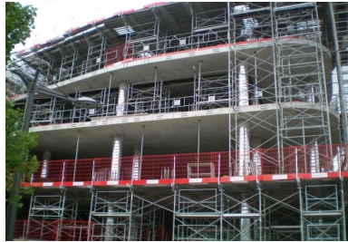
Pavillon 52 - Lyon Confluences. Coulés en place, les planchers précontraints par post-tension disposent d'une souplesse de mise en œuvre qui s'adapte aux courbes irrégulières des différents niveaux.