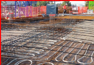
Pavillon 52 - Lyon Confluences. Intégrant avant coulage un échangeur thermique alimenté par la nappe phréatique (tubes blancs sur la photo), les planchers précontraints assurent le chauffage-rafraîchissement de l'immeuble. L'absence de poutres garantit une distribution thermique uniforme sur toute la surface.