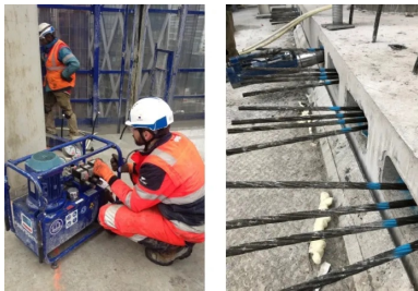
Tour Hekla - La Défense. Après que le béton a atteint une certaine résistance, les câbles sont tendus à l'aide d'une pompe hydraulique (à gauche). Lors de cette étape, l'extrémité libre de chaque câble est tirée par des vérins vers l'extérieur, ce qui a pour effet de comprimer le béton entre les points d'ancrage des câbles. Un effort de 22,3 tonnes est appliqué sur chaque câble.