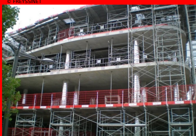
Pavillon 52 - Lyon Confluences. Coulés en place, les planchers précontraints par post-tension disposent d'une souplesse de mise en œuvre qui s'adapte aux courbes irrégulières des différents niveaux.