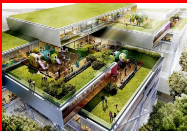
Hôpital Mater - Dublin (Irlande). En dégagant de vastes plateaux, les planchers précontraints par post-tension permettent une grande flexibilité dans l'aménagement intérieur. Cette flexibilité est particulièrement précieuse dans les hôpitaux, où l'espace peut devoir être réaménagé pour répondre à de nouvelles exigences ou technologies médicales. Par ailleurs, la grande capacité portante de ces planchers leur permet de supporter facilement de lourds équipements médicaux (scanners, équipements de radiologie...).