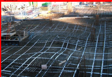
Hôpital Mater - Dublin (Irlande). Les câbles de précontrainte sont installés en suivant une forme de « vague ». Cette ligne suit la courbe des moments des forces qui s'exercent dans le plancher.