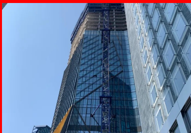
Tour Hekla - La Défense (Hauts-de-Seine, architecte Jean Nouvel). Les 46 niveaux de cette tour de 220 mètres de haut sont constitués de planchers précontraints par post-tension. Cette solution technique permettait de s'adapter à la forme unique et complexe de la tour - tous les planchers disposent d'une géométrie unique - tout en respectant les délais de construction et en diminuant l'empreinte carbone de l'ouvrage de 30 % par la réduction des quantités de béton et d'armatures d'acier. © FREYSSINET

En phase de construction, certaines étapes de mise en œuvre sont allégées – suppression des coffrages des retombées de poutre – réduction ou suppression des joints de dilatation – ou simplifiées – gestion des réservations pour les réseaux. Enfin, tout au long de la vie de l'immeuble, le maître d'ouvrage diminue ses charges d'exploitation et d'entretien. « Au final, une étude économique comparative réalisée pour chaque projet démontre la diminution des coûts réels globaux pour le donneur d'ordres », résume Ivica Zivanovic.