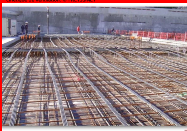
Parking Gérard Philipe - La Garde (Var). Installation des câbles de précontrainte avant coulage, longitudinalement et transversalement. La compression générée par la précontrainte permet de diminuer la quantité d'armatures passives.