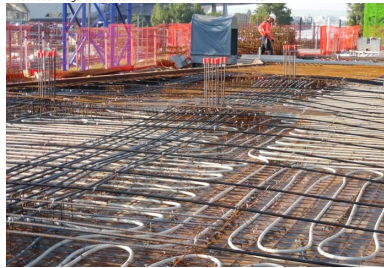
Pavillon 52 - Lyon Confluences. Intégrant avant coulage un échangeur thermique alimenté par la nappe phréatique (tubes blancs sur la photo), les planchers précontraints assurent le chauffage-rafraîchissement de l'immeuble. L'absence de poutres garantit une distribution thermique uniforme sur toute la surface.