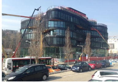
Le Pavillon 52 - situé dans le quartier Lyon Confluences (Rhône). Cet immeuble de bureaux en R+6, conçu par l'architecte Rudy Ricciotti, développe une surface de 7 700 m 2 . La technique des planchers précontraints par post-tension a été choisie par le maître d'œuvre pour au moins trois raisons : la nécessité de disposer de grands plateaux, la capacité à épouser les formes ondulantes des différents niveaux, et la possibilité d'y intégrer un système de plafond chauffant.

Ces arguments environnementaux pèsent de tout leur poids à l'heure où la réglementation environnementale RE 2020, en vigueur depuis le 1er janvier 2022, impose une limitation de l'impact carbone des bâtiments sur l'ensemble de leur cycle de vie , et notamment pendant les phases de construction et d'exploitation.