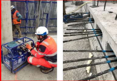
Tour Hekla - La Défense. Après que le béton a atteint une certaine résistance, les câbles sont tendus à l'aide d'une pompe hydraulique (à gauche). Lors de cette étape, l'extrémité libre de chaque câble est tirée par des vérins vers l'extérieur, ce qui a pour effet de comprimer le béton entre les points d'ancrage des câbles. Un effort de 22,3 tonnes est appliqué sur chaque câble.