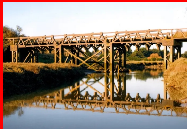
Construit en 1916, le pont du Marais peut être considéré comme un prototype en tant que premier pont en béton au monde entièrement préfabriqué et assemblé sur place. Il a bénéficié d'un financement européen pour sa restauration.