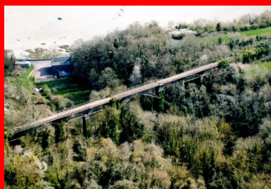
(© Armelle Ouvrat)

Ancien pont de la voie ferrée Yffiniac-Matignon, situé sur les communes de Plévenon et Fréhel, le viaduc de Port-Nieux a été construit de 1913 à 1916. Un ouvrage d'art à grand arc central, construit en moellons de grès et en béton armé. Précédé côté Fréhel d'une passerelle d'accès de 55 m, il mesure dans sa totalité 207 m de long et 29 m de hauteur. Il se compose de sept travées d'arc de 12 m de portée chacune et d'un grand arc central en béton armé de 28,50 m de portée. Construit en béton armé, le tablier est couronné de garde-corps en croix de Saint-André également en béton armé. Cet ouvrage d'art est aujourd'hui en mauvais état, envahi par la végétation.