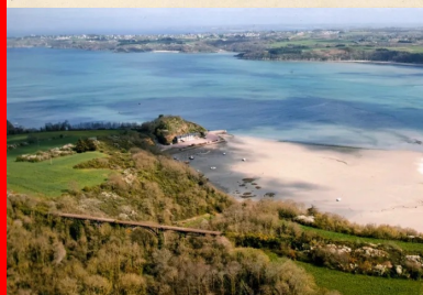
Depuis 2010, date à laquelle cette photo a été prise, le viaduc de Port-Nieux a été envahi et recouvert par la végétation, le rendant à ce jour presque invisible

« Il y a deux choses dans un édifice : son usage et sa beauté. Son usage appartient au propriétaire, sa beauté à tout le monde », disait Victor Hugo. Avec Harel de la Noë, les ouvrages d'art deviennent des œuvres d'art grâce à la combinaison de l'utile et du beau, de la robustesse et de l'élégance. Chargé de créer le premier réseau de voies ferrées d'intérêt local dans les Côtes-du-Nord, il a imposé ses choix audacieux malgré le conservatisme du Conseil général des ponts : recours à des matériaux peu coûteux et des pierres locales, nouveaux modes de construction, réalisation des grands ouvrages d'art en régie... Sortent alors de terre deux réseaux de 250 et 200 km de voies ferrées et une soixantaine d'ouvrages (ponts, gares, châteaux d'eau) pour traverser un paysage au relief capricieux. Si de nombreux ingénieurs ont été pionniers dans l'emploi du ciment armé à la lisière des XIX e et XX e siècles, Harel de la Noë, lui, l'a expérimenté à grande échelle. Il a aussi été un pionnier dans la standardisation et la préfabrication d'éléments en béton armé .