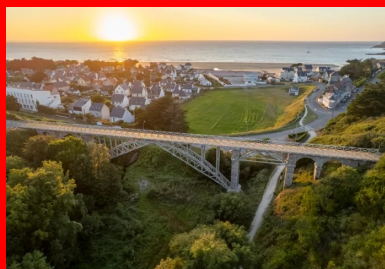
D'une longueur totale de 109,25 m, le viaduc de Caroual, situé à Erquy (22), comprend un arc central de 45 m de portée en béton armé. Il a été restauré en 2021.