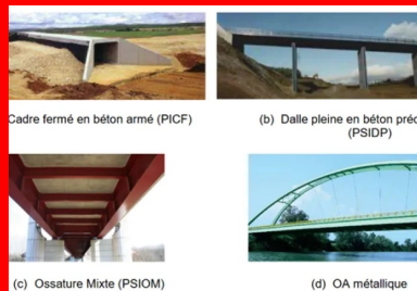
Exemples de pont cadre, pont dalle, pont à poutres et OA métallique pouvant être étudiés par CIOGEN.

La version de juillet 2023 s'intéresse aux OA courants, c'est-à-dire aux ponts-type du SETRA (ponts cadres et portiques, ponts-dalles, ponts à poutres), catégorie qui peut être élargie à des ouvrages approchant (ponts à béquilles, ponts cadres ou portiques multiples, etc.). Des évolutions sont envisagées dans l'avenir pour traiter d'autres types d'ouvrages de génie civil.