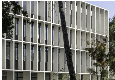
Une écriture architecturale atemporelle et élégante, fondée sur une géométrie rigoureuse.

Abritées derrière la tour d'ombre, les façades sont de type rideau, constituées d'un complexe filant devant les planchers béton. À ossature bois, elles intègrent une isolation par l'extérieur en laine de bois de forte densité soumise à un avis d'expérimentation sur le chantier et protégée par un capotage métal. Elles sont doublées côté intérieur d'une paroi béton qui renforce le degré d'isolation par son inertie. Le choix d'une façade « multicouche » offrant un fort déphasage thermique n'est qu'un des exemples exprimant la volonté de réaliser un bâtiment minimisant ses empreintes carbone et énergétique.