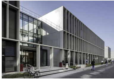
Côté nord, la résille de béton d'une épaisseur de 40 cm s'adapte à l'orientation et s'amincit.

Sa construction a marqué le début de la transformation de ce site universitaire. Le nouvel édifice vient avantageusement remplacer des éléments préfabriqués et vétustes, énergivores et peu confortables, pour offrir un équipement de qualité, respectueux de son environnement . Implanté en suivant l'alignement du plan original du campus défini par l'architecte Louis Sainsaulieu, le bâtiment H vient s'insérer avec justesse, telle la pièce manquante d'un puzzle. Situé le long de la ligne B du tramway bordelais, à proximité de l'allée Ausone, il bénéficie, côté sud, d'un terrain boisé en cours d'aménagement. Conçu de manière à préserver au maximum les arbres existants, il présente une volumétrie séquencée en trois parties, dont le gabarit et la hauteur s'adaptent aux bâtiments voisins afin de créer un ensemble harmonieux, à échelle humaine.