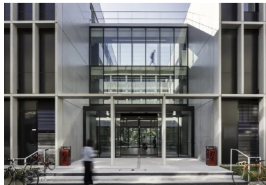
Le hall d'entrée, entièrement vitré et traversant, fait le lien entre les deux volumes les plus importants.

Cette composition tripartite répond également aux besoins du programme en offrant une lisibilité et un fonctionnement indépendants à chaque pôle. Au centre, l'élément haut, la Maison de l'économie, se déploie sur quatre niveaux, pôle majeur par ses activités de recherche innovantes et son rayonnement géographique. À l'ouest, le volume en R+2 accueille les administrations et les espaces de formation. À l'est, les salles informatiques, le plateau VIA Inno et les locaux annexes forment la plus petite entité en R+1.