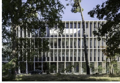
Côté sud, le long de la ligne de tramway, la résille de béton qui protège la façade affiche une profondeur de 80 cm.

Protégé derrière sa résille en béton préfabriqué, il complète un site universitaire en pleine restructuration et en modifie l'image.