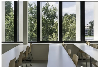
La résille extérieure en béton protège sans refermer, ni entraver les vues.