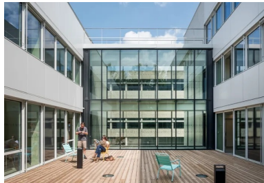
L'un des larges patios inscrits au cœur du bâtiment.