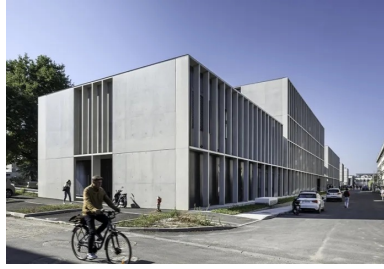
L'implantation du bâtiment H recrée une rue en s'inscrivant dans le plan original du campus.

Côté matériaux, le parti pris est celui de la mixité. Du béton , du métal, du verre et du bois. Le béton s'affiche de deux façons. À l'extérieur, il se montre pour former une résille protectrice qui fait fonction de tour d'ombre autour du bâtiment. Son épaisseur varie en fonction des besoins pour apporter une protection solaire efficace au sud, à l'est et à l'ouest. La mise en place de ce système de tour d'ombre a permis d'augmenter les surfaces vitrées et d'offrir un bâtiment à la fois ouvert et protégé.