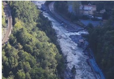
À Fontan, les brèches n° 19 et n° 20 sur la RD 6204, emportée sur 150 m.

Dans la nuit du 2 au 3 octobre 2020, les vallées de la Vésubie, de la Tinée, de la Roya et dans une moindre mesure celle de l'Estéron ont été touchées par une catastrophe naturelle d'une ampleur telle qu'elle dépasse celle d'une crue centennale. Le bilan matériel et humain fut très lourd - 10 morts, 8 disparus, plus de 200 brèches recensées sur 70 km de routes départementales. Dans la seule vallée de la Roya, ce furent un million de mètres cubes de matériaux déplacés, des infrastructures routières et des ponts pulvérisés, isolant le village de Castérino au bout de la RD 91 et coupant totalement la RD 6204 entre Breil-sur-Roya et Tende, rendant impossible l'accès au nord de la vallée jusqu'à la frontière italienne. La cellule de crise mise en place par la préfecture et le conseil départemental a eu pour premier objectif d'établir des accès provisoires pour les riverains et l'approvisionnement nécessaire aux travaux.