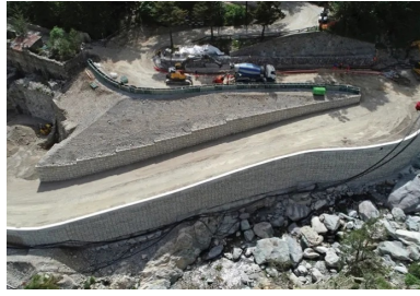
RD 91. Reconstruction des lacets du lac des Mesches avec des murs en remblais renforcés en RediRock® pour garantir une esthétique soignée.

Autre problématique : trouver une solution technique pour permettre aux groupements d'entreprises de traiter 50 à 60 chantiers de front. Pour ce faire, la mission Reconstruction décline un carnet des solutions techniques de soutènement selon la nature des brèches.