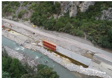
Saorge, RD 6204. Brèche n° 12 : réalisation d'un mur cantilever en béton coulé en place.

Enfin, après un inventaire exhaustif des dégâts sur le terrain, le conseil départemental a utilisé la procédure des marchés négociés pour gagner du temps.