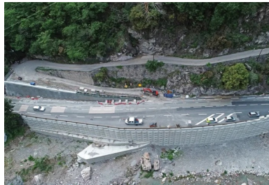
RD 6204. Réalisation d'une paroi AD/OC® et d'une paroi clouée en béton projeté pour la brèche 18b.

Utilisés notamment sur les brèches 7 et 8, les murs AD/OC® (brevet NGE) sont des parois clouées combinées avec des éléments préfabriqués en béton armé en forme de pointe de diamant servant de parement de la paroi en continu. Chaque module est ancré au substratum rocheux par le biais d'une barre d'ancrage puis liaisonné avec les autres. Un matériau granulaire drainant de type ballast vient ensuite combler l'interface entre le substratum rocheux et le parement. Constituée de plusieurs centaines d'écailles, la surface de la brèche 7 (465 m) est à ce jour la plus grande superficie réalisée au monde.