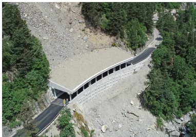
Paravalanche RD 91. La galerie paravalanche combine des éléments préfabriqués et du béton coulé en place.

La même RD 91 présentait un risque élevé de chutes de blocs, notamment au niveau de la brèche béante 25, éventrée sur 60 m de long. Pour se prémunir vis-à-vis des écoulements, la mission lance un marché de conception-réalisation d'une galerie paravalanche réalisée par NGE GC. En raison du contexte (faible emprise chantier, topographie, altitude, distance, éboulements...), cet ouvrage combine l'usage d'éléments préfabriqués (butons parasismiques, poutres aux extrémités de la traverse supérieure...) et du béton coulé en place . Cette hybridation a permis de gagner un mois de délai sur le planning de réalisation. Structuellement, la galerie est bordée en amont et en aval par deux murs de soutènement, l'un et l'autre reposant sur des longrines profondes sur micropieux. Des poteaux soutiennent la traverse supérieure qui protège la route des chutes de blocs.