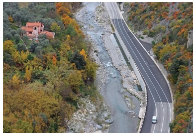
Saorge, RD 6204. Brèche n° 12 : réalisation d'un mur cantilever en béton coulé en place.

Pendant plusieurs semaines, plusieurs facteurs ont interdit tout passage terrestre ou ferroviaire. Seule la voie des airs permettait de porter secours aux populations enclavées et d'assurer le ravitaillement.