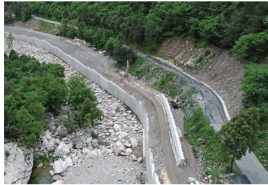
RD 91. Brèches n° 2 et 3 : réalisation d'un mur cantilever en béton coulé en place (8 m de haut) surmonté d'un deuxième mur en ModBloc® (mur poids en blocs béton préfabriqués).

Quant au béton coulé en place, plus ou moins structurel, il fut d'abord acheminé par toupies depuis Menton (Vicat) et l'Italie, puis à partir de juin 2021 par une centrale à béton (Vicat) installée à Breil-sur-Roya.