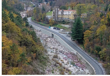
La route est désormais protégée et contenue par de nouveaux soutènements en béton : un mur poids et un ouvrage hydraulique préfabriqué.

En octobre 2020, la tempête Alex a détruit des routes et isolé des villages. Malgré l'urgence et les défis techniques, les travaux ont été réalisés dans une logique de résilience sur le long terme.