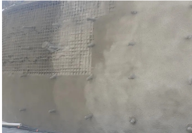
Paroi clouée, brèche n° 40.

Très impactée, la RD 91 est une petite route de montagne qui relie Saint-Dalmas de Tende à Castérino, 12 km plus haut, à 1 520 m d'altitude. Ici, plusieurs glissements ont occasionné une cinquantaine de brèches qui ont complètement détruit des portions de route. Toutes ont été reconstruites en recourant à diverses techniques. À brèche complexe, méthodologie adaptée. L'exemple de la brèche 39 montre combien le mot « complexe » n'est pas abusif. Compte tenu de la raideur des pentes et de l'exiguïté en fond de vallée, la réalité imposait de positionner la piste provisoire à l'emplacement du mur de soutènement. On mesure la difficulté de réaliser un soutènement sur une minuscule emprise avec des véhicules qui passent régulièrement à l'endroit même du chantier. Il a donc fallu organiser une opération « coup de poing » qui consistait à couper la circulation pendant 72 h, le temps de construire un premier mur de soutènement provisoire. Pour ce faire, le groupement d'entreprises du marché d'urgence a mis en place des moyens humains et matériels considérables qui travaillaient nuit et jour (3 x 8). Ce mur provisoire, qui servait à rétablir la circulation à court terme, est aujourd'hui sous la route. Le soutènement définitif a été réalisé en paroi clouée en béton projeté pour conforter l'ouvrage provisoire.