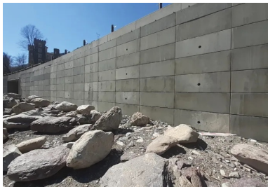
Mur poids en écaillies préfabriquées pour la brèche n° 19.