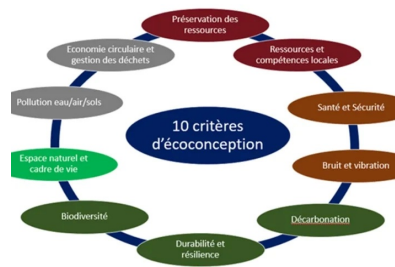
Illustration 4 : Ecoconception des ouvrages de génie civil en 4 principes et 10 critères