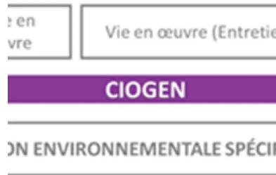
Illustration 3 : CIOGEN, évaluation des impacts environnementaux sur l'ensemble du cycle de vie de l'ouvrage

Génie civil et écoconception : la spécificité béton