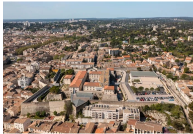
Vue aérienne qui permet de deviner l'emprise initiale du fort et son extension, au nord, dans laquelle prend place le pôle sportif universitaire.

Dans le nord de la ville, l'ancien fort de Nîmes construit à la fin du XVII e siècle sur un coteau, devenu lieu d'incarcération au XVIII e siècle et jusque dans les années 1990, a été transformé ensuite pour accueillir l'université de Nîmes. Suivant l'intervention de l'architecte Andrea Bruno, les bâtiments et services de l'université se répartissent à l'intérieur de l'enceinte de la citadelle, y compris dans les douves. Restait une réserve foncière disponible, la partie nord de la parcelle construite en extension de la citadelle d'origine, dont les bâtiments d'incarcération ont été démolis et remplacés par une pinède.