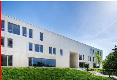
Vue de la façade nord.