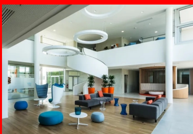
Le hall à la fois double hauteur et traversant est conçu comme un cœur de village, qui accueille, distribue et offre des espaces de détente.

La structure du bâtiment est entièrement réalisée en béton et associe différentes solutions. De façon générale, les dalles de plancher sont portées par les voiles coulés des noyaux servants centraux et les façades porteuses en panneaux préfabriqués de type murs à coffrage et isolation intégrés. Dans certaines parties du projet, lorsqu'il existe un décalage des plans de façade, comme au niveau du grand hall ou quand les panneaux de façade sont remplacés par des parois vitrées, la structure est de type poteaux-poutres. Les panneaux (MCI) de façade ont une épaisseur de 40 cm. Le voile intérieur, porteur, est de 20 cm et sa face visible dans les salles de formation et bureaux est laissée brute. Le voile de parement extérieur, matricé ou brut, a 8 cm d'épaisseur et l'isolant 12 cm. Ces panneaux participent à la performance du bâtiment qui atteint un niveau conforme à la RT 2012 - 40 %.