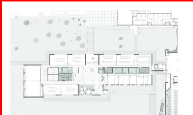
Plan de rez-de-chaussée 1. Entrée 2. Accueil 3. Hall 4. Salles de formations 5. Bureaux des formateurs

Ils sont longés de part et d'autre par un couloir de desserte. Au rez-de-chaussée, sont regroupés les bureaux des formateurs, des espaces de co-working et toutes les salles de formation. Ces dernières se répartissent le long des façades nord, ouest et sud. Le premier et le deuxième étage sont réservés aux bureaux de l'entreprise. De différentes tailles, certains de grande dimension sont traités en open space. Sur ces deux étages, les bureaux sont entièrement modulables en fonction des besoins de l'entreprise et de leurs évolutions. Dans tout le bâtiment, les couloirs sont séparés des salles de formation et des bureaux par des cloisons vitrées sérigraphiées. Les utilisateurs sont ainsi protégés des regards et les circulations bénéficient de la présence de la lumière naturelle qui agrément les parcours.