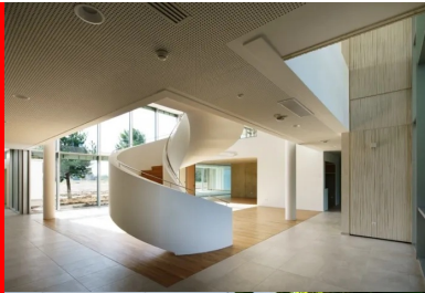
Vue sur le hall et la courbe de l'escalier, avant aménagement.