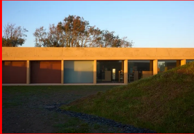
La façade nord est rythmée par les poteaux-lames en béton dont la finesse de la tranche contraste avec l'épaisseur de la dalle qui les soutiennent.

La dalle est supportée de part et d'autre par des poteaux-lames et des voiles extérieurs, les parois vitrées et pleines des locaux qu'elle abrite étant placées en retrait . Ce dispositif permet de faire varier les vues et la pénétration de la lumière naturelle mais aussi la perception du bâtiment — plateforme flottante entre deux talus ou toiture pesante et protectrice.