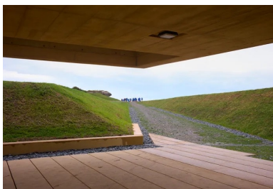
Les porte-à-faux offrent des préaux à l'abri des intempéries.

Le pavillon a été distingué par le prix 10+1 organisé par la revue d'architecture d'A.