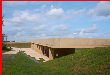
Le béton teinté dans la masse s'accorde aux couleurs et aux matières du paysage environnant.