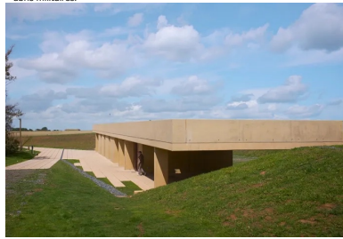
Le béton teinté dans la masse s'accorde aux couleurs et aux matières du paysage environnant.