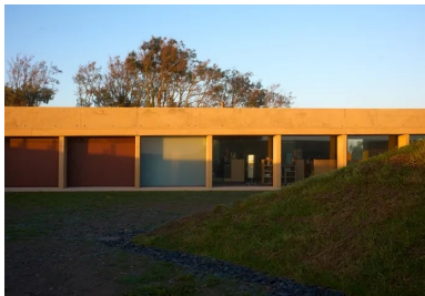
La façade nord est rythmée par les poteaux-lames en béton dont la finesse de la tranche contraste avec l'épaisseur de la dalle qu'ils soutiennent.

La dalle est supportée de part et d'autre par des poteaux-lames et des voiles extérieurs, les parois vitrées et pleines des locaux qu'elle abrite étant placées en retrait. Ce dispositif permet de faire varier les vues et la pénétration de la lumière naturelle mais aussi la perception du bâtiment — plateforme flottante entre deux talus ou toiture pesante et protectrice.