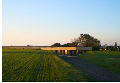
Le nouveau pavillon s'installe avec légèreté dans l'épaisseur du site.

Plateforme en béton intégrée à la topographie du site, le nouveau pavillon d'accueil de la batterie de Longues-sur-mer conjugue paysage et architecture au service de l'histoire.