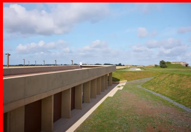
Le belvédère s'élançait vers l'ouest, indiquant le chemin vers la première casemate.

Situé à l'arrière de la batterie, le nouvel édifice remplace l'ancien pavillon d'accueil, jugé inadapté. Par soucis de discrétion vis-à-vis des vestiges historiques alentours et d'insertion paysagère, il est construit dans une tranchée jouant à la fois de la topographie et du modelage du sol. L'accès piétons depuis la zone de stationnement aménagée au sud, mène jusqu'à l'entrée ouest du bâtiment niché au bout de cette tranchée. Tout en longueur, le pavillon s'étire d'ouest en est sur 54 mètres et 8,70 mètres de largeur par 4 à 5 mètres de hauteur. Il se termine à chaque extrémité par un porte-à-faux de 7,20 mètres, qui forment ainsi deux auvents protecteurs de la pluie, du vent et du soleil, suivant la saison. Entre les deux, se trouvent l'office du tourisme et divers locaux fermés, techniques et de stockage.