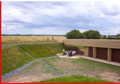
L'accès à la toiture-terrasse s'effectue directement depuis le talus à l'angle sud-est.

La dalle est supportée de part et d'autre par des poteaux-lames et des voiles extérieurs, les parois vitrées et pleines des locaux qu'elle abrite étant placées en retrait . Ce dispositif permet de faire varier les vues et la pénétration de la lumière naturelle mais aussi la perception du bâtiment — plateforme flottante entre deux talus ou toiture pesante et protectrice.