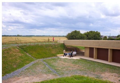
L'accès à la toiture-terrasse s'effectue directement depuis le talus à l'angle sud-est.

La toiture-terrasse constituée d'une dalle épaisse en béton , accessible dans le prolongement du talus sur l'extrémité est, accuse volontairement une légère pente, s'élevant progressivement d'un mètre : une manière de donner la direction vers la première casemate et, en retour, d'inscrire le pavillon dans le parcours de ce chapelet d'abris militaires qui ponctuent encore le littoral. « Seul l'horizon est horizontal dans le site » justifie Adrien de Bellaigue, l'un des associés de l'agence d'architecture dbo conceptrice du projet, ajoutant « la toiture donne une direction et permet d'être plus tapis dans sol à l'est qu'à l'ouest où elle émerge du terrain. » Depuis ce belvédère, le paysage qui s'offre rassemble l'horizon, le littoral, le plateau agricole et l'arrière pays. Par temps clair, on perçoit côté terre au-delà de Bayeux et, côté mer, la pointe de Barfleur et la baie de Seine, faisant comprendre l'implantation stratégique de la batterie de Longues-sur-Mer.