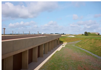
Le belvédère s'élanç vers l'ouest, indiquant le chemin vers la première casemate.

Situé à l'arrière de la batterie, le nouvel édifice remplace l'ancien pavillon d'accueil, jugé inadapté. Par souci de discrétion vis-à-vis des vestiges historiques alentours et d'insertion paysagère, il est construit dans une tranchée jouant à la fois de la topographie et du modelage du sol. L'accès piétons depuis la zone de stationnement aménagée au sud, même jusqu'à l'entrée ouest du bâtiment niché au bout de cette tranchée. Tout en longueur, le pavillon s'étire d'ouest en est sur 54 mètres et 8,70 mètres de largeur par 4 à 5 mètres de hauteur. Il se termine à chaque extrémité par un porte-à-faux de 7,20 mètres, qui forment ainsi deux auvents protecteurs de la pluie, du vent et du soleil, suivant la saison. Entre les deux, se trouvent l'office du tourisme et divers locaux fermés, techniques et de stockage.