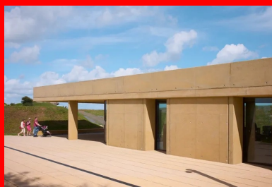
Les voiles de structure en béton de la façade sud rappellent la compacité des abris militaires.

Située entre les plages d'Omaha-Beach et de Gold-Beach, en pleine zone du débarquement des forces alliées le 6 juin 1944 en Normandie, Longues-sur-Mer conserve en bon état de cette période sa batterie de tir de canon construite en béton armé par les Allemands : quatre casemates qui abritaient les canons de marine longue portée et, à l'avant, le poste de direction de tir. Prise par les troupes britanniques dès le lendemain du débarquement, elle fit l'objet d'un classement au titre des Monuments historiques en 2001. Lieu de mémoire du « mur de l'Atlantique » donc, cette petite commune rurale du Calvados de moins de 600 habitants voit passer jusqu'à 400 000 visiteurs par an. L'affluence qui ne se dément pas, voire augmente, justifiait la construction d'un pavillon à même d'accueillir et d'orienter tout au long de l'année l'afflué conséquent de personnes. Le projet se devait d'améliorer les conditions d'accueil à la batterie mais aussi d'intégrer l'office du tourisme.