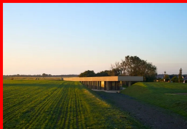
Le nouveau pavillon s'installe avec légèreté dans l'épaisseur du site.

Plateforme en béton intégrée à la topographie du site, le nouveau pavillon d'accueil de la batterie de Longues-sur-mer conjugue paysage et architecture au service de l'histoire.