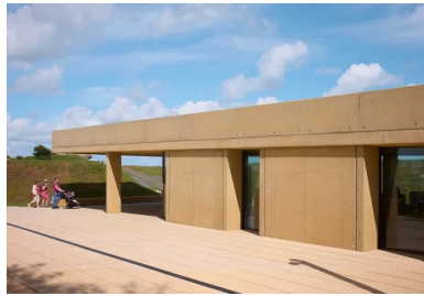
Les voiles de structure en béton de la façade sud rappellent la compacité des abris militaires.

Située entre les plages d'Omaha-Beach et de Gold-Beach, en pleine zone du débarquement des forces alliées le 6 juin 1944 en Normandie, Longues-sur-Mer conserve en bon état de cette période sa batterie de tir de canon construite en béton armé par les Allemands : quatre casemates qui abritaient les canons de marine longue portée et, à l'avant, le poste de direction de tir. Prise par les troupes britanniques dès le lendemain du débarquement, elle fit l'objet d'un classement au titre des Monuments historiques en 2001. Lieu de mémoire du « mur de l'Atlantique » donc, cette petite commune rurale du Calvados de moins de 600 habitants voit passer jusqu'à 400 000 visiteurs par an. L'affluence qui ne se dément pas, voire augmente, justifiait la construction d'un pavillon à même d'accueillir et d'orienter tout au long de l'année l'afflué conséquent de personnes. Le projet se devait d'améliorer les conditions d'accueil à la batterie mais aussi d'intégrer l'office du tourisme.