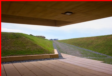
Les porte-à-faux offrent des préaux à l'abri des intempéries.

Le pavillon a été distingué par le prix 10+1 organisé par la revue d'architecture d'A.