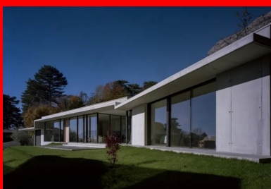
La façade principale se caractérise par l'articulation des volumes et le contraste entre généreuses surfaces vitrées et béton banché.

Conçue par l'architecte grenoblois Guy Depollier pour une famille de quatre personnes, la maison particulière à Meylan, en Isère, est implantée sur une longue parcelle face au splendide massif de Belledonne. Exposée au sud, sa volumétrie étirée et coudée s'explique par les limites parcellaires et les courbes altimétriques du terrain. La maison étant longée par un chemin à l'arrière, côté nord, elle oppose une longue paroi aveugle. Par contraste, la façade sud face au majestueux paysage alpin fait la part belle aux surfaces vitrées, à peine masquées par trois poteaux métalliques élancés de 16 cm de diamètre.