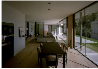
Dans l'espace à vivre, la porte en bois et le parquet marquent un contraste avec les emmarchements et le débord de toiture en béton.

et le débord de toiture. Ces surfaces, ainsi que la sous-face de l'auvent, sont en béton architectonique obtenu par coulage entre des banches métalliques dont témoignent les trous d'étrésillons. À l'intérieur, seuls le garage et le bloc technique des pièces d'eau sont en béton apparent. Ce caractère apparent se retrouve dans les différents revêtements de sol. On pense notamment à la rampe d'accès pour véhicules en béton désactivé dont les agrégats concassés et les couleurs ont été choisis.