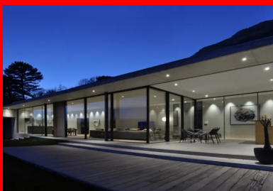
En soirée, l'éclairage artificiel met en valeur l'intérieur devancé par la loggia et le platelage en bois de la terrasse. Le béton n'est dès lors plus visible qu'au sol.

Avec son porte-à-faux d'un mètre, le débord de toiture exerce une fonction esthétique majeure consistant à éviter un acrotère d'une soixantaine de centimètres de hauteur. Celui-ci se présente sous la forme d'une poutre acrotère avec son relevé d'étanchéité, à l'aplomb de la façade vitrée. Le débord assure aussi une protection solaire partielle, notamment contre les rayons du soleil très verticaux les jours d'été. Cette protection est complétée par une série de brise-soleil orientables, objets d'une étude technique poussée, en partie haute de la façade vitrée. Il s'agissait en effet de les loger dans un caisson , avec les différents réseaux techniques, au nu du faux-plafond suspendu en plaques de plâtre . Ce détail est essentiel car il participe d'un autre double objectif : la discrétion et l'optimisation des surfaces vitrées.