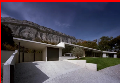
Dès l'entrée, la maison séduit par ses lignes tendues et la variété des surfaces en béton.

Le défi consistant à bâtir une maison d'habitation face à un paysage montagneux a été relevé par une conception délicate et respectueuse du site. Dans ce projet, le béton s'exprime par ses diverses surfaces et son caractère minéral.