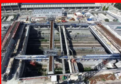
Vue de dessus du projet qui permet de visualiser la contrainte ferroviaire.

La raréfaction de l'offre de foncier dans les hyper-centres-villes conduit les maîtres d'ouvrage à explorer des solutions innovantes pour maximiser l'utilisation des espaces disponibles. Le projet Aurore T5B, situé dans le 13 e arrondissement de Paris, est un exemple emblématique de cette reconstruction de « la ville sur la ville ». Ce programme ambitieux, qui comprend un hôtel de luxe et un bâtiment culturel pour une surface de planchers totale de 12 000 m 2 , est en effet situé... au-dessus des voies ferrées de la gare d'Austerlitz !