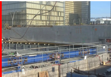
Les méga-poutres sont ripées sur des chemins de ripage, eux-mêmes appuyés sur des files situées 3 m plus bas par l'intermédiaire de palets.