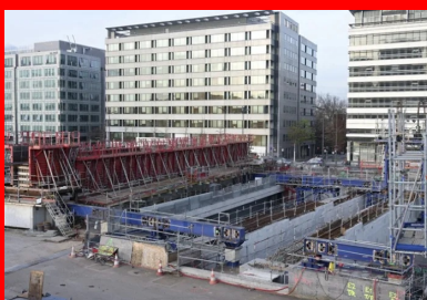
Vue globale montrant l'aire de préfabrication des méga-poutres (poutre coffrée, banches rouges).

Destinées à reprendre les charges des bâtiments en superstructure, les méga-poutres sont également conçues pour « porter » le sous-sol des bâtiments. « La Compagnie de Phalsbourg, notre maître d'ouvrage, souhaitait pouvoir disposer les locaux techniques de ses bâtiments sous le niveau de la dalle. L'espace interstitiel situé entre deux méga-poutres est donc utilisé pour y installer des locaux visitables de 2 m de hauteur sous plafond », décrit Régis Rancier, responsable études pour Egis. Ce sous-sol « suspendu », dont les âmes des méga-poutres constituent les murs, devait être conforme à la réglementation incendie. « C'est principalement pour cette raison de résistance au feu que la solution béton a été préférée à l'acier », justifie Régis Rancier.