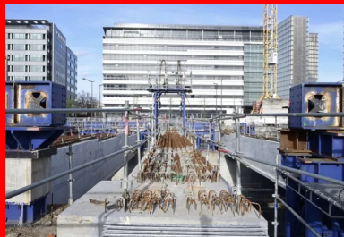
Vue d'une poutre à sa position définitive. Aperçu des équipements de manutention lourde : portique de levage et chemin de ripage.

En décembre 2020, un incident technique grave – n'impliquant toutefois aucun accident de personne – survient sur le chantier de la dalle de couverture du TSB, démarré un an auparavant. Le projet est alors mis en pause pendant deux ans. Durant cette période, le maître d'ouvrage fait appel au Cerema, dans un premier temps pour mener un audit structurel des éléments déjà réalisés, et dans un deuxième temps pour assumer la conception en place et achever le projet en remplacement du maître d'œuvre précédent. Les travaux ont ainsi pu reprendre en février 2023 pour s'achever avant la tenue des Jeux olympiques.