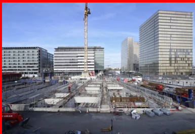
Intégration du projet dans son milieu urbain.

Portée par neuf méga-poutres en béton armé, une dalle déployée au-dessus des voies ferrées de la gare d'Austerlitz devient « sol » aedificandi .