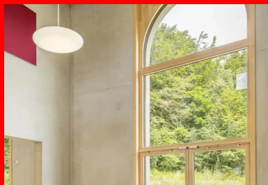
Le béton brut des murs et du plafond, associé à des éléments en bois et à la lumière naturelle qui pénètre par la grande fenêtre, l'imposte vitrée placée dans la double hauteur et la circulation qualifient le volume des salles.