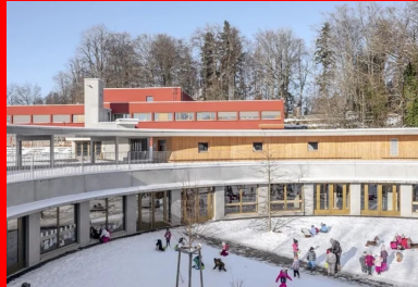
La cour des maternelles occupe tout l'espace central du cercle.