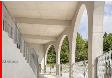
À partir du porche d'entrée, les escaliers mènent directement à la cour haute.