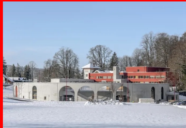
À travers les grandes arches cintrées qui marquent l'entrée se devine l'intérieur de l'école. Au second plan, le bâtiment réhabilité repeint en rouge.

Lové dans une dépression du terrain, le cercle scolaire La Franche-Montagne s'inscrit profondément dans le sol, au sens physique du terme. Il marque une entrée de la ville, par son architecture singulière - un bâtiment circulaire, en anneau, contenu dans de hauts voiles de béton -, ajoutant une dimension ludique à l'expression de son statut d'équipement public à vocation pédagogique et protectrice. Il remplace l'ancienne école du centre-ville de cette petite commune de moyenne montagne du massif du Jura située à une dizaine de kilomètres de la frontière franco-suisse, dont la capacité d'accueil est devenue insuffisante, difficile à étendre et à mettre aux normes.