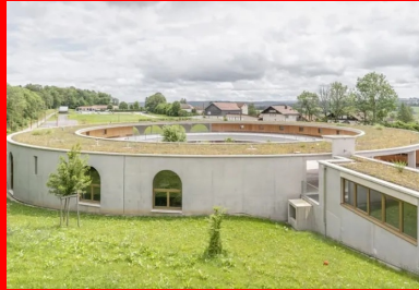
Encastrée dans le talus, l'extension ceinte par des murs de béton brut, sobres. La toiture végétalisée contribue à son insertion paysagère.

Avec son enceinte de béton brut , le cercle scolaire La Franche-Montagne conçu par les architectes de BQ+A se coule dans la topographie du site.