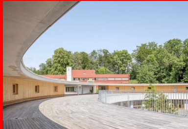
La cour des élémentaires, aménagée sur la toiture intermédiaire.