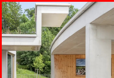
À l'étage, le passage protégé vers l'école élémentaire avec sa casquette anguleuse qui laisse filer la courbe de la toiture.

Précédé d'une « langue » de parking paysager associé à deux noues pour infiltrer les eaux de pluie à la parcelle et bordé par un champ, le bâtiment se déploie à partir d'une doline, une excavation circulaire généralement fermée, à fond plus ou moins plat. De plan circulaire, l'extension y est calée de manière à préserver la vue du bâtiment existant situé en partie haute du terrain, créant un étage depuis l'entrée, avec la cour haute et la toiture plantée qui atténue l'effet de hauteur de ses murs courbes de 8 m.