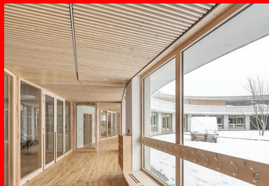
Circulation vitrée qui borde d'un côté la cour des maternelles, de l'autre les salles qu'elle distribue.

Réhabilité et réaménagé pour accueillir les classes d'élémentaire, le bâtiment existant construit dans les années 1970 fonctionne avec le nouveau bâtiment où se trouvent, en plus des salles de classe maternelle, toutes les salles communes au groupe scolaire comme le réfectoire, la bibliothèque et la salle polyvalente ainsi que l'accueil périscolaire. Visibles depuis le parvis de l'entrée commune traitée en porche avec ses arcades hautes, la cour des maternelles occupe le centre du cercle à rez-de-chaussée et, au-dessus, la cour haute en anneau et en balcon est celle des élèves d'élémentaire. Sans être mélangés, les élèves gardent un contact visuel et, sans doute, sonore. La cour haute, aménagée sur la toiture intermédiaire, est en partie protégée du soleil et de la pluie sur sa périphérie par le débord de la toiture en béton . Le bois du sol et des murs confère une intériorité à cet espace à ciel ouvert atypique où les enfants s'ébattent ou se posent et parfois, usage imprévu, l'utilisent en vélodrome.