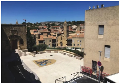
Le parvis rénové du château de l'Empéri accueille un nouveau dallage en béton bouchardé, spécialement étudié pour s'accorder aux remparts du château.

Maitrise d'ouvrage : Ville de Salon-de-Provence - Maitrise d'œuvre : Atelier des paysages-Alain Marguerit - Entreprises : TP VRD Gagneraud TP, TP Provence, Eiffage TP - Réalisation des bétons désactivés : Provence Impressions RCR Deco France, Sols-Méditerranée Fournisseur du béton : Cemex Fournisseur du ciment : Lafarge