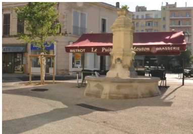
Le béton drainant, une solution efficace contre l'« inondabilité chronique ».