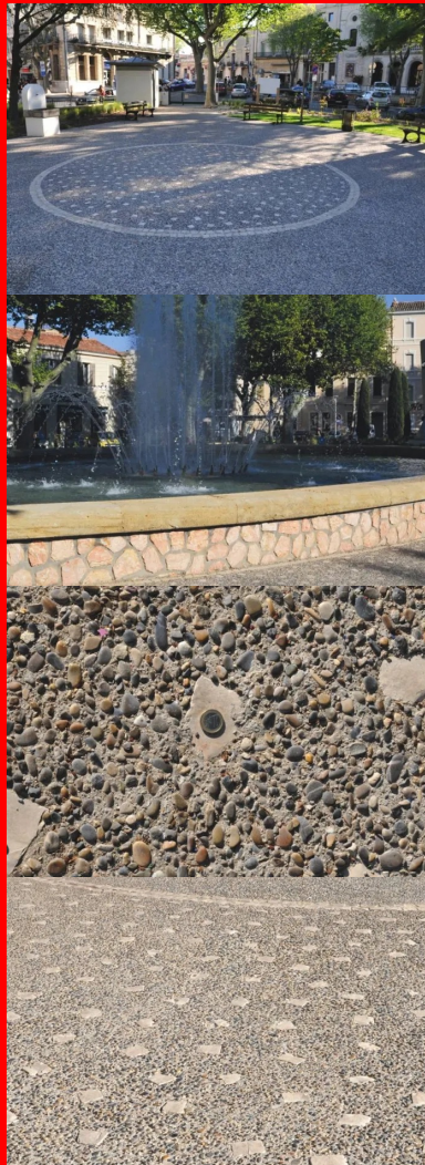
Le béton désactivé avec granulats roulés de Durance, cloutés de petits pavés calcaires, a métamorphosé le square Charles-de-Gaule.