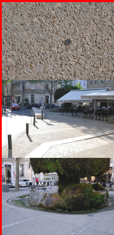
Les cailloux utilisés dans les bétons décoratifs proviennent de la carrière de Châteauneuf-les-Martigues (Bouches-du-Rhône), située à 50 km.

Le marché (dit « de définition ») lancé à l'origine a très vite montré « qu'il fallait envisager le problème de façon beaucoup plus large pour rester cohérent et englober dans cette réflexion les cours du centre-ville, vitaux pour l'activité économique, car ils accueillent de nombreux commerces », expliquaient à l'époque les responsables des services techniques (cf. Routes n° 98, décembre 2006, pp. 18-19). Problème important : l'absence de réseau d'eaux pluviales posant de « sérieux soucis en matière d'hygiène publique ». À la moindre intempérie, tout se déversait dans le canal de Craonne, un ouvrage datant de la Renaissance et destiné à irriguer la plaine environnante de la Crau. En prime, il existait encore d'anciennes canalisations en plomb, posant des problèmes en matière d'assainissement et d'eau potable.