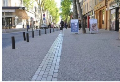
Le calepinage des bandes structurantes en pierre Cénia rythme les différents espaces (terrasses de café, fontaines) et les trottoirs qui ont été élargis.

C'est là que tout a commencé... Ambition : redonner aux avenues principales du centre-ville une unité esthétique perdue au fil des décennies. C'est ce qui a guidé la Ville, au milieu des années 2000, dans le choix du béton désactivé . Rajeunis, tout en restant parfaitement dans la tradition, ces fameux « cours » provençaux ont accueilli deux bétons désactivés différents, avec des cailloux concassés calcaires clairs (carrière de Châteauneuf-les-Martigues, dans les Bouches-du-Rhône) et un calepinage très esthétique de bandes structurantes en pierres calcaires naturelles Cénia. Ces avenues séculaires méritaient mieux que le patchwork de revêtements qu'elles portaient à l'époque. Sans parler des problèmes de planimétrie, de stationnement, de circulation.