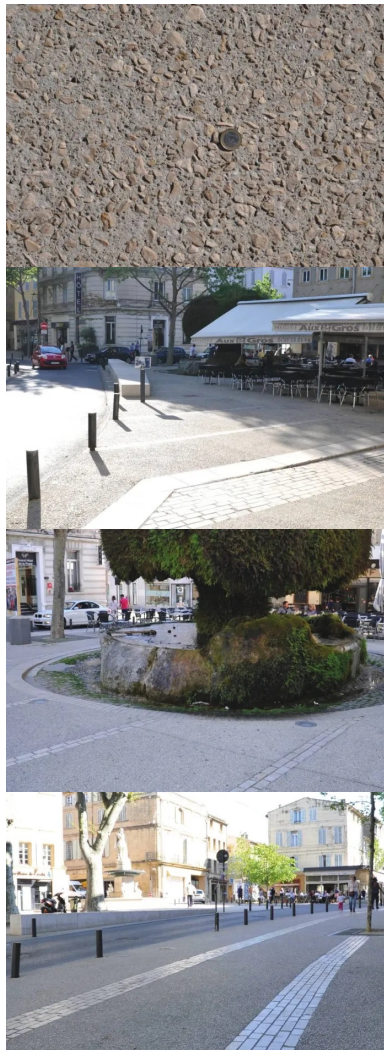
Les cailloux utilisés dans les bétons décoratifs proviennent de la carrière de Châteauneuf-les-Martigues (Bouches-du-Rhône), située à 50 km.

Le marché (dit « de définition ») lancé à l'origine a très vite montré « qu'il fallait envisager le problème de façon beaucoup plus large pour rester cohérent et englober dans cette réflexion les cours du centre-ville, vitaux pour l'activité économique, car ils accueillent de nombreux commerces », expliquaient à l'époque les responsables des services techniques (cf. Routes n° 98, décembre 2006, pp. 18-19). Problème important : l'absence de réseau d'eaux pluviales posant de « sérieux soucis en matière d'hygiène publique ». À la moindre intempérie, tout se déversait dans le canal de Craonne, un ouvrage datant de la Renaissance et destiné à irriguer la plaine environnante de la Crau. En prime, il existait encore d'anciennes canalisations en plomb, posant des problèmes en matière d'assainissement et d'eau potable.