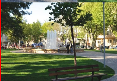
Réalisés en béton désactivé (avec granulats roulés de Durance), les cheminements du square Charles-de-Gaulle de Salon-de-Provence sont cloutés de petits pavés calcaires.