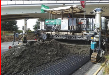
Le nu supérieur des barres longitudinales des armatures se situe entre 80 et 100 mm de la surface du revêtement.