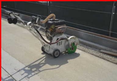
Des amorces de fissuration ont été réalisées par sciage au plus vite après le bétonnage. But : le développement rapide de fissures plus droites et régulières, réduisant le risque de regroupement.

Les armatures : situées entre 8 et 10 cm de la surface du béton Elles sont indispensables à la réalisation du BAC : elles lui confèrent sa continuité et doivent être de bonne qualité. Le diamètre des armatures longitudinales est de 20 mm, celui des armatures transversales de 12 mm, avec un écartement entre les axes des armatures longitudinales de 170 mm. La nappe d'armature est positionnée pour se situer entre 8 et 10 cm de la surface du béton, légèrement au-dessus de la fibre neutre. Le rôle de cette armature est de contrôler la fissuration du béton lors de son retrait . Les fissures ont généralement une ouverture de l'ordre de 0,3 mm et ne laissent pénétrer ni l'eau ni les sels de déverglaçage.