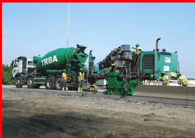
Sur le nouveau tronçon, 18 500 m de dispositifs de retenue en béton ont été coulés en place.

Particularité complémentaire du chantier : 170 000 tonnes de béton, issues de la démolition de l'ancienne structure, ont été recyclées, après concassage, dans les fondations.