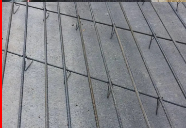
disposées tous les 170 mm, les armatures longitudinales ont un diamètre de 20 mm. Espacées de 700 mm, les armatures transversales (12 mm de diamètre) les croisent selon un angle de 60°.