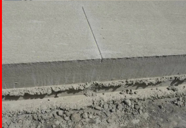
Les amorces mesurent 40 cm de longueur.