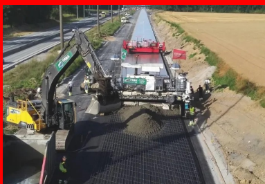
La nouvelle autoroute E42/A8 Kain-Lamain a nécessité la pose de 230 000 m 2 de BAC.