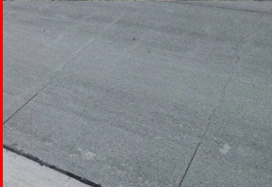
Les amorces sont réalisées tous les 120 cm.