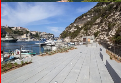
L'esplanade en belvédère sur le paysage.