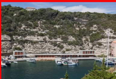
L'édifice épouse les courbes de la falaise.

Une esplanade paysagée, avec des essences issues du plateau bonifacien, et accessible au public est aménagée sur les 20 box des pêcheurs. À plus de 3 m du sol, elle constitue un espace public en belvédère sur le port offrant aux usagers des vues magnifiques sur le paysage alentour. »