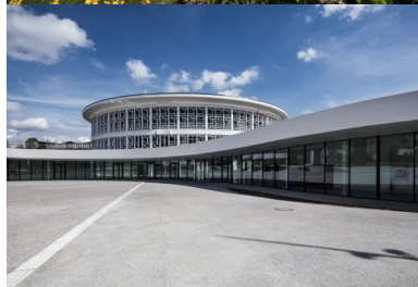
La façade largement vitrée de l'extension rend visible de l'extérieur ce qui se passe dans le bâtiment et invite à entrer.