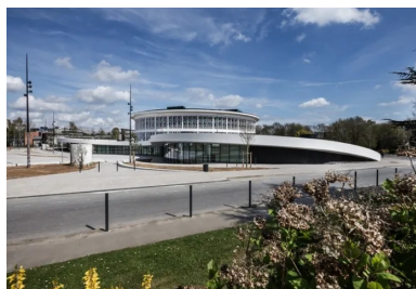
L'acrotère blanc en béton dessine un renforcement qui libère au sol un vaste parvis.

Le bâtiment d'origine a fait l'objet d'une réorganisation et d'une rénovation complète. La coupole en pavés de verre, qui dominait le cœur de l'édifice, est remplacée par une verrière contemporaine lumineuse, disposée à un niveau plus élevé. Elle éclaire ainsi un espace formant un atrium intérieur généreux, véritable foyer spatial de Lilliad. L'ondulation de l'extension, soulignée par son acrotère blanc en béton, dessine un renforcement qui libère au sol un vaste parvis. L'ondulation de l'extension, soulignée par son acrotère blanc en béton, dessine un renforcement qui libère au sol un vaste parvis ouvert en direction du cœur de la vie étudiante du campus, où sont regroupés l'espace culturel et la maison des étudiants. L'entrée du Learning Center Innovation donne sur le parvis. La façade largement vitrée de l'extension rend visible de l'extérieur ce qui se passe dans le bâtiment et invite à entrer.