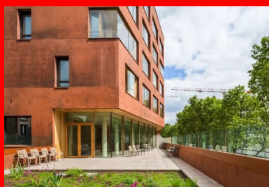
une terrasse généreuse prolonge la salle à manger, au premier niveau du pôle d'hébergement pour personnes âgées.

Choisi pour son caractère minéral, le béton forme ici autant le corps que l'enveloppe du bâtiment. La structure est principalement constituée des voiles périphériques de 22 cm d'épaisseur, porteurs, coulés en place et réalisés en béton autoplaçant. Cette ossature de type « coque » s'autocontrevente partiellement, les cages d'escaliers intérieurs assurant le reste du contreventement. Les évidements prévus dans la construction ont imposé quelques porte-à-faux dont celui de 7,5 m situé à l'angle du premier étage. Les retombées de poutres intérieures trop importantes n'étant pas compatibles avec l'aménagement prévu, l'ensemble des efforts conséquents à ces évidements a été repris dans les voiles porteurs. Si la structure comprenait quelques points épineux à résoudre par le calcul, la réelle « aventure » du projet fut celle de la mise en œuvre du béton souhaité par les architectes (voir encadré) - un béton architectonique , coulé en place et teinté dans la masse. Ce béton exprime une certaine brutalité pour jouer les contrastes avec les autres matériaux employés, le verre des garde-corps, le châtaignier utilisé pour revêtir les murs des loggias et le métal thermolaqué des éléments de finition.