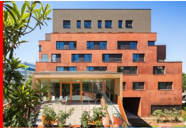
Le centre d'accueil de jour bénéficie d'un bel espace extérieur associant terrasse et espace planté.