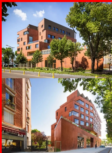
Le socle, sur deux niveaux, suit l'alignement urbain et assoit le bâtiment, vu comme un tout depuis la rue.

Le troisième parti pris découle de la position de la parcelle au croisement de deux avenues, insufflant un traitement de l'angle qui se devait d'être monumental. Enfin, le quatrième puise sa source dans l'environnement du bâtiment. En effet, pour faire écho aux façades en briques voisines de l'ensemble de logements HBM, les architectes ont décidé d'employer un matériau minéral, le béton , qui leur permettait de donner à la fois de la présence, une matérialité et une teinte sur mesure, en harmonie avec celle de la brique.