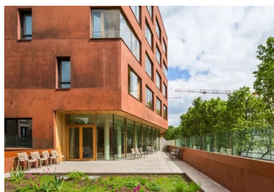
une terrasse généreuse prolonge la salle à manger, au premier niveau du pôle d'hébergement pour personnes âgées.

Choisi pour son caractère minéral, le béton forme ici autant le corps que l'enveloppe du bâtiment. La structure est principalement constituée des voiles périphériques de 22 cm d'épaisseur, porteurs, coulés en place et réalisés en béton autoplaçant. Cette ossature de type « coque » s'autocontrevente partiellement, les cages d'escaliers intérieurs assurant le reste du contreventement. Les évidements prévus dans la construction ont imposé quelques porte-à-faux dont celui de 7,5 m situé à l'angle du premier étage. Les retombées de poutres intérieures trop importantes n'étant pas compatibles avec l'aménagement prévu, l'ensemble des efforts conséquents à ces évidements a été repris dans les voiles porteurs. Si la structure comprenait quelques points épineux à résoudre par le calcul, la réelle « aventure » du projet fut celle de la mise en œuvre du béton souhaité par les architectes (voir encadré) – un béton architectonique , coulé en place et teinté dans la masse. Ce béton exprime une certaine brutalité pour jouer les contrastes avec les autres matériaux employés, le verre des garde-corps, le châtaignier utilisé pour revêtir les murs des loggias et le métal thermolaqué des éléments de finition.