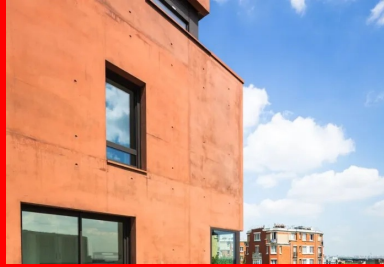
La fragmentation des volumes des étages permet la création de multiples surfaces extérieures.