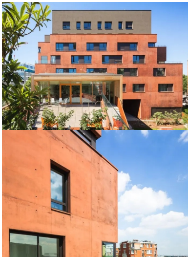
Le centre d'accueil de jour bénéficie d'un bel espace extérieur associant terrasse et espace planté.