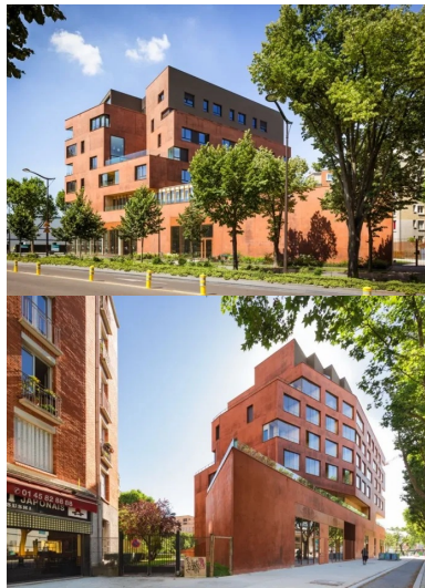
Le socle, sur deux niveaux, suit l'alignement urbain et assise le bâtiment, vu comme un tout depuis la rue.

Le troisième parti pris découle de la position de la parcelle au croisement de deux avenues, insufflant un traitement de l'angle qui se devait d'être monumental. Enfin, le quatrième puise sa source dans l'environnement du bâtiment. En effet, pour faire écho aux façades en briques voisines de l'ensemble de logements HBM, les architectes ont décidé d'employer un matériau minéral, le béton , qui leur permettait de donner à la fois de la présence, une matérialité et une teinte sur mesure, en harmonie avec celle de la brique.