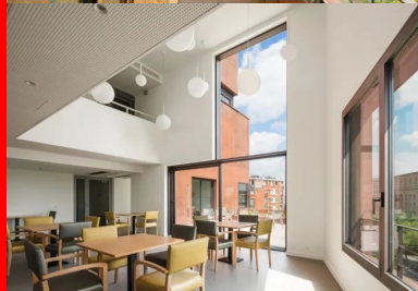
La plupart des pièces de vie commune se déploient dans un volume en double hauteur.