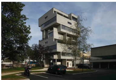
Les jeux d'emboîtements, de pleins et de creux sculptent les volumes des tours et permettent d'individualiser chaque logement dans l'ensemble.

Au fil des années, les deux bâtiments ont fait l'objet de travaux qui ont dénaturé l'architecture d'origine. Les huisseries bois-aluminium ont été remplacées par du PVC , des stores extérieurs de piètre facture avaient été rajoutés à l'extérieur, etc. Après l'arrêt de la centrale d'Ivry, le personnel logé sur place quitte petit à petit les lieux. En 2000, EDF vend les deux tours de logements à un marchand de biens. Celui-ci demande à l'AUA Paul Chemetov de faire une étude de réhabilitation qui restera sans suite. Une longue période d'incertitude s'ouvre alors. Les logements sont un temps squattés et malmenés. Les tours sont murées pour éviter toute occupation illicite. La menace de leur démolition plane. Leur inscription à l'inventaire supplémentaire des monuments historiques en 2003 éloigne définitivement le spectre de la démolition. Cependant, elles vont encore rester à l'abandon de nombreuses années, pendant lesquelles actes de vandalisme, tags, vieillissement dû à l'absence d'entretien les marqueront de leurs stigmates. L'achat de l'ensemble du site par la Sadev 94 (Société d'aménagement et de développement des villes et du département du Val-de-Marne), en 2010, met fin à cette sombre et trop longue période. La Sadev 94 relance alors le projet de réhabilitation conçu par Paul Chemetov.