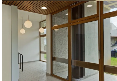
Le hall de la grande tour.