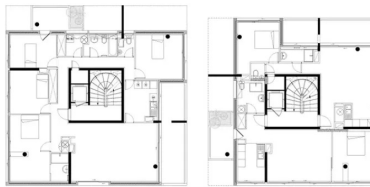
Plan R+2 petite tour 2016