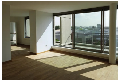
Intérieur d'un appartement de la grande tour.