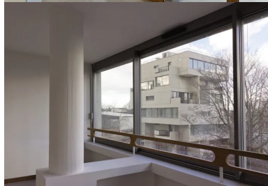
Vue sur la petite tour depuis un appartement de la grande tour.