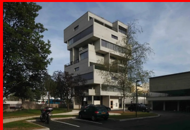
Les jeux d'emboîtements, de pleins et de creux sculptent les volumes des tours et permettent d'individualiser chaque logement dans l'ensemble.

Au fil des années, les deux bâtiments ont fait l'objet de travaux qui ont dénaturé l'architecture d'origine. Les huisseries bois-aluminium ont été remplacées par du PVC , des stores extérieurs de piètre facture avaient été rajoutés à l'extérieur, etc. Après l'arrêt de la centrale d'Ivry, le personnel logé sur place quitte petit à petit les lieux. En 2000, EDF vend les deux tours de logements à un marchand de biens. Celui-ci demande à l'AUA Paul Chemetov de faire une étude de réhabilitation qui restera sans suite. Une longue période d'incertitude s'ouvre alors. Les logements sont un temps squattés et malmenés. Les tours sont murées pour éviter toute occupation illícite. La menace de leur démolition plane. Leur inscription à l'inventaire supplémentaire des monuments historiques en 2003 éloigne définitivement le spectre de la démolition. Cependant, elles vont encore rester à l'abandon de nombreuses années, pendant lesquelles actes de vandalisme, tags, vieillissement dû à l'absence d'entretien les marqueront de leurs stigmates. L'achat de l'ensemble du site par la Sadev 94 (Société d'aménagement et de développement des villes et du département du Val-de-Marne), en 2010, met fin à cette sombre et trop longue période. La Sadev 94 relance alors le projet de réhabilitation conçu par Paul Chemetov.