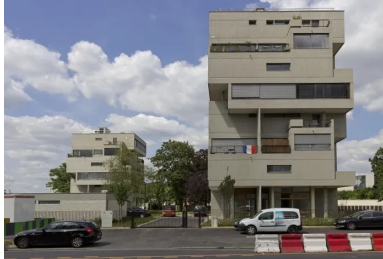
Les deux tours vues du boulevard Colonel Fabien.