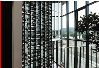
L'espace en double hauteur du hall est animé par un « mur à vins ».