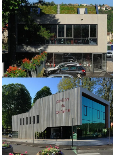
La toiture végétalisée se confond avec le paysage lointain.

Chaque année, un très grand nombre de visiteurs viennent découvrir la ville et ses alentours. Le nouveau pavillon du tourisme de Vienne et du Pays Viennois a pour vocation de les accueillir et de les informer tout en étant la vitrine de la ville et du territoire. Il se dresse au bord du Rhône à l'angle nord-ouest du parc du 8 mai 1945. Il est sculpté par son enveloppe en béton gris clair matricé, laissé brut de décoffrage , qui se découpe sur la végétation du parc. Sa matière et la vibration de sa texture animent la peau du bâtiment et accompagnent le porte-à-faux de l'étage, tendu vers le Rhône. Sur la façade nord, les lettres de l'enseigne « pavillon du tourisme » s'impriment en creux dans le béton. Enchâssées dans l'enveloppe minérale, trois parois en verre habillent la façade nord et les côtés ouverts sous le porte-à-faux. Le pavillon du tourisme offre ainsi à ses visiteurs un vaste linéaire vitré, ouvert sur l'espace urbain et sur le Rhône. « Par sa forme et son esprit, notre projet évoque un pavillon, soulevé du sol, qui expose sa terre, son terroir, ses racines, ses ressources et ses plaisirs. Au sens architectural, ce pavillon a la force d'une " folie ", objet inattendu, signal visible de toute part, qui interroge, suscite l'intérêt et la visite. Au sens imagé, ce pavillon est la chambre d'écho de l'office du tourisme, à l'écoute et au service des acteurs de son territoire », expliquent les architectes.