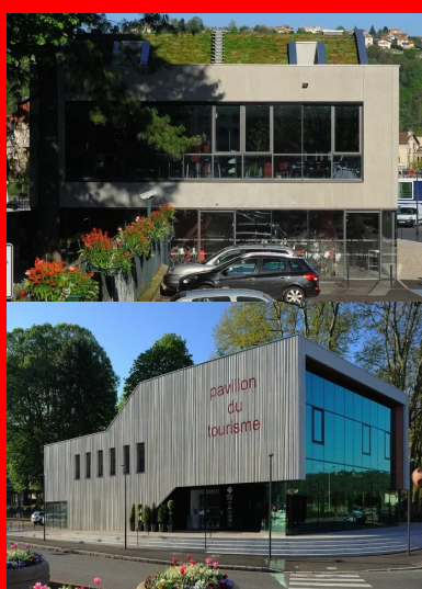
La toiture végétalisée se confond avec le paysage lointain.

Chaque année, un très grand nombre de visiteurs viennent découvrir la ville et ses alentours. Le nouveau pavillon du tourisme de Vienne et du Pays Viennois a pour vocation de les accueillir et de les informer tout en étant la vitrine de la ville et du territoire. Il se dresse au bord du Rhône à l'angle nord-ouest du parc du 8 mai 1945. Il est sculpté par son enveloppe en béton gris clair matricé, laissé brut de décoffrage qui se découpe sur la végétation du parc. Sa matière et la vibration de sa texture animent la peau du bâtiment et accompagnent le porte-à-faux de l'étage, tendu vers le Rhône. Sur la façade nord, les lettres de l'enseigne « pavillon du tourisme » s'impriment en creux dans le béton. Enchâssées dans l'enveloppe minérale, trois parois en verre habillent la façade nord et les côtés ouverts sous le porte-à-faux. Le pavillon du tourisme offre ainsi à ses visiteurs un vaste linéaire vitré, ouvert sur l'espace urbain et sur le Rhône. « Par sa forme et son esprit, notre projet évoque un pavillon, soulevé du sol, qui expose sa terre, son terroir, ses racines, ses ressources et ses plaisirs. Au sens architectural, ce pavillon a la force d'une " folie ", objet inattendu, signal visible de toute part, qui interroge, suscite l'intérêt et la visite. Au sens imagé, ce pavillon est la chambre d'écho de l'office du tourisme, à l'écoute et au service des acteurs de son territoire », expliquent les architectes.