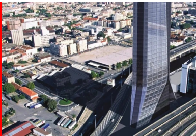
Tour CMA-CGM, Marseille. L'évacuation des immeubles de grande hauteur (IGH) est une opération longue et complexe qui nécessite tout le soutien structurel que peuvent apporter les qualités de résistance au feu du matériau béton.

Dans un bâtiment, la résistance et la stabilité au feu des matériaux et des solutions constructives doivent être privilégiées afin de faciliter l'évacuation des occupants et l'intervention des équipes de secours.