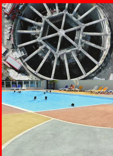
Bassin d'orage de Chaudre Rivière, Communauté urbaine de Lille. Cet ouvrage de lutte contre les inondations se compose de deux bassins circulaires en béton, reliés par un canal de surverse de l'un vers l'autre.