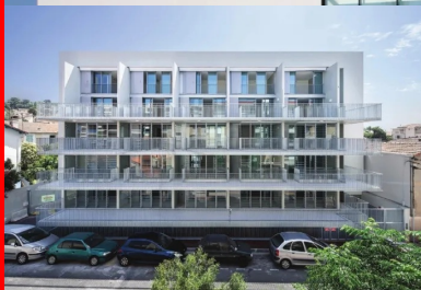
Logements, Cannes La Bocca. Les architectes de ce petit collectif ont intégré les contraintes résultantes de sa situation en zone sismique 3 avec brio.