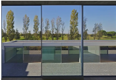
Vue sur le paysage depuis une chambre.