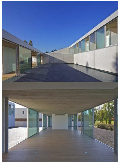
Le patio et la piscine.

La structure du pavillon est de type poteaux/dalles en béton , ce qui permet d'obtenir des plateaux en plan libre. Les murs périphériques sont réalisés avec des panneaux préfabriqués matricés de 7 m de haut x 2,4 m de large, qui sont clavetés aux éléments de structure coulés en place. Ils présentent un parement gris brut et un motif qui a l'aspect des coffrages en planche de bois traditionnels. Les dalles de planchers sont coulées sur un coffrage perdu, composé de planches en bois dont le calepinage a été dessiné par l'architecte. Ainsi, le plafond du grand espace de séjour/réception et celui des chambres ont un parement brut animé par l'empreinte du dessin des planches de coffrage, qui fait écho à la texture de l'enveloppe.