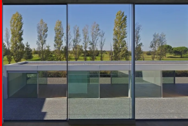
Vue sur le paysage depuis une chambre.