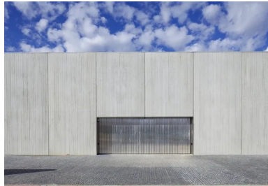
Les murs sont réalisés avec des panneaux en béton préfabriqué matricé.

« Chaque espace tente de se décharger des contraintes techniques afin d'assurer diverses fonctions à la fois spécifiques et évolutives, commente l'architecte. Ainsi, les pièces telles que les chambres/bureaux avec salle de bains sont peu marquées par leur usage, et davantage caractérisées par l'ambiance, en cohérence avec l'ensemble du projet. Le vaste volume transparent du séjour/salle de réunion/d'exposition/de réception est entièrement ouvert d'un côté sur le patio pavé et sa piscine d'apparat et de l'autre sur la terrasse vers le golf. L'atelier présente un volume vaste éclairé par une grande fenêtre au nord. Il se prolonge par une " placette extérieure " pour recevoir ou encore exposer des œuvres. »