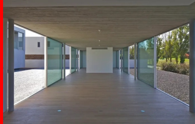
Fluidité et ouverture des espaces.

La sobriété de l'écriture architecturale décline un minimalisme élégant dont les matières, les textures, le jeu des lumières et des vues mettent en valeur la fluidité des espaces et leur ouverture sur le paysage.