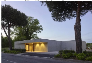
L'édifice s'inscrit dans la végétation omniprésente.