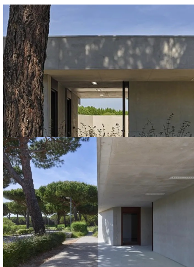
Frais et ombragé, le porche s'ouvre sur le patio.